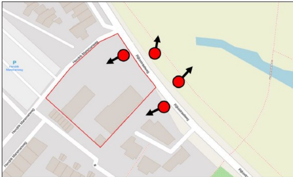
Figuur 1: Tijdelijke maatregelen gewone grootoorvleermuis (VKWS04) aan bomen.