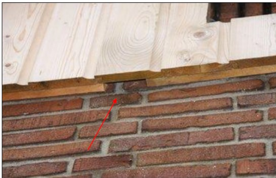
Figuur 4: Voorbeeld gevelbetimmering als extra permanente maatregel voor gewone grootoorvleermuis aan nieuwbouwwoningen. Voor de huismuis (bovenwettelijk) blijven de eerste 3 rijen dakpannen van de nieuwbouwwoningen toegankelijk.