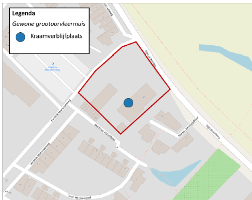
Figuur 2: Bij benadering locatie kraamverblijfplaats gewone grootoorvleermuis .