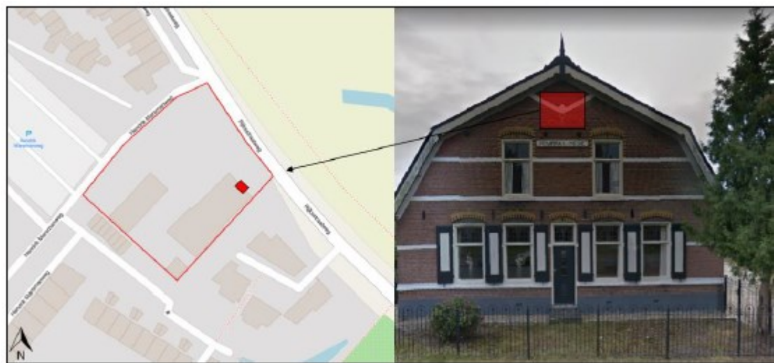
Figuur 2: Extra tijdelijke kraamkast voor gewone grootoorvleermuis (VKSK01) aan voorgevel woning.