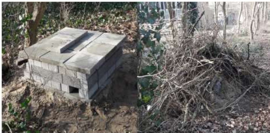
Figuur B3.2 Voorbeeld van een steenmartenverblijfplaats, met een fundering van stenen (links) en afgewerkt met takken (rechts).