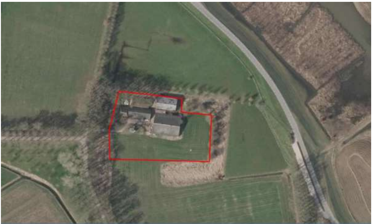
Figuur 1. Ligging plangebied.

De boerderijwoning met een aangebouwde schuur is gebouwd van steen en de daken zijn bedekt met dakpannen. De overige schuren en stallen zijn gebouwd met hout en hebben een dak van golfplaten. Verder bestaat het terrein uit verharding, ruigtes, bomen en wordt het terrein begrenst door een oude gracht. De aanliggende percelen betreffen graslanden. Tevens bevindt zich ten oosten/ zuidoosten van het projectgebied een wateroppervlak dat grotendeels is dichtgegroeid met riet.