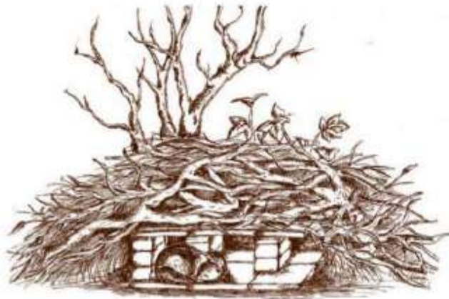
Figuur B3.1 Een tekening van een vervangende steenmartenverblijfplaats zoals voorgesteld door de zoogdiervereniging.