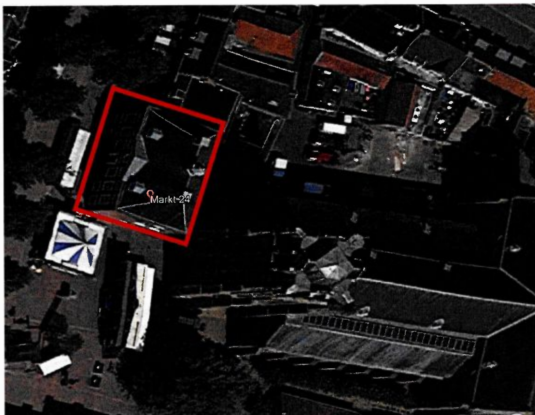
Globale begrenzing (rode lijn) van het plangebied Markt 24, Wijk bij Duurstede met ten oosten de Grote kerk.