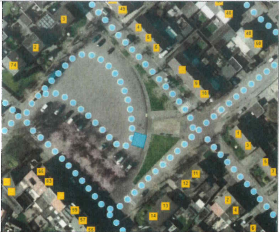
Foto 1 locatie voorstel