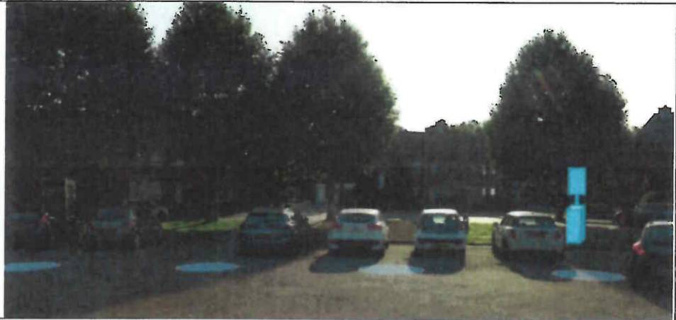
Foto 2 locatie voorstel