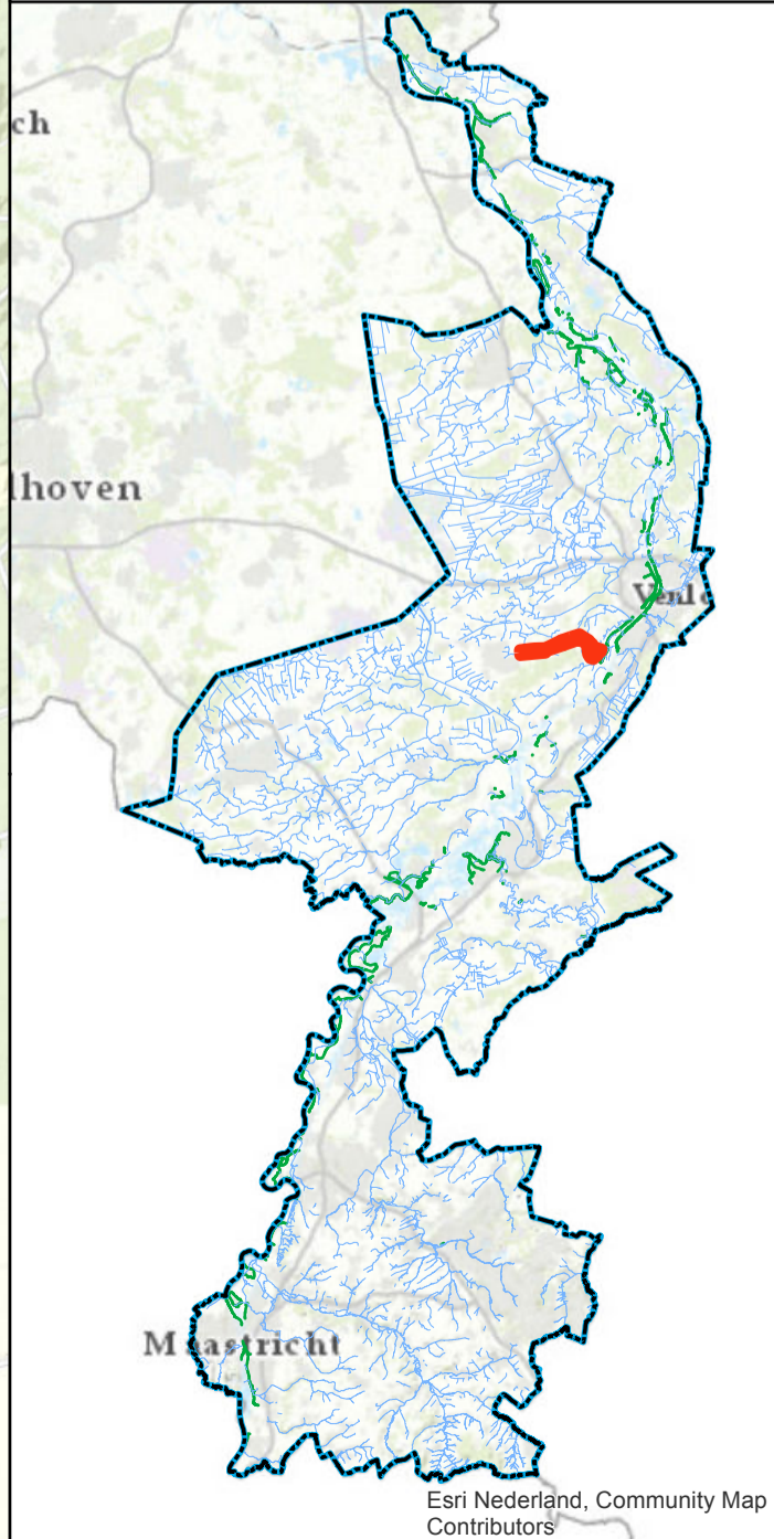
Overzichtskaartje (schaal 1:650.000)