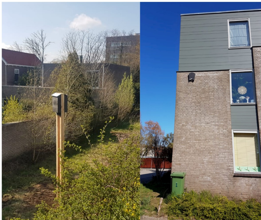
Figuur 3: Links de vleermuispaal naast het pand aan de Blecourtstraat en rechts 1 van de 8 kasten aan het Archipelhof