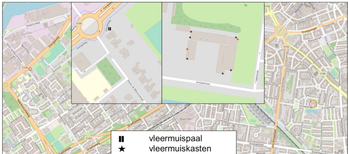
Figuur 2: Ligging locaties van de vleermuisvoorzieningen (rood omcirkeld)