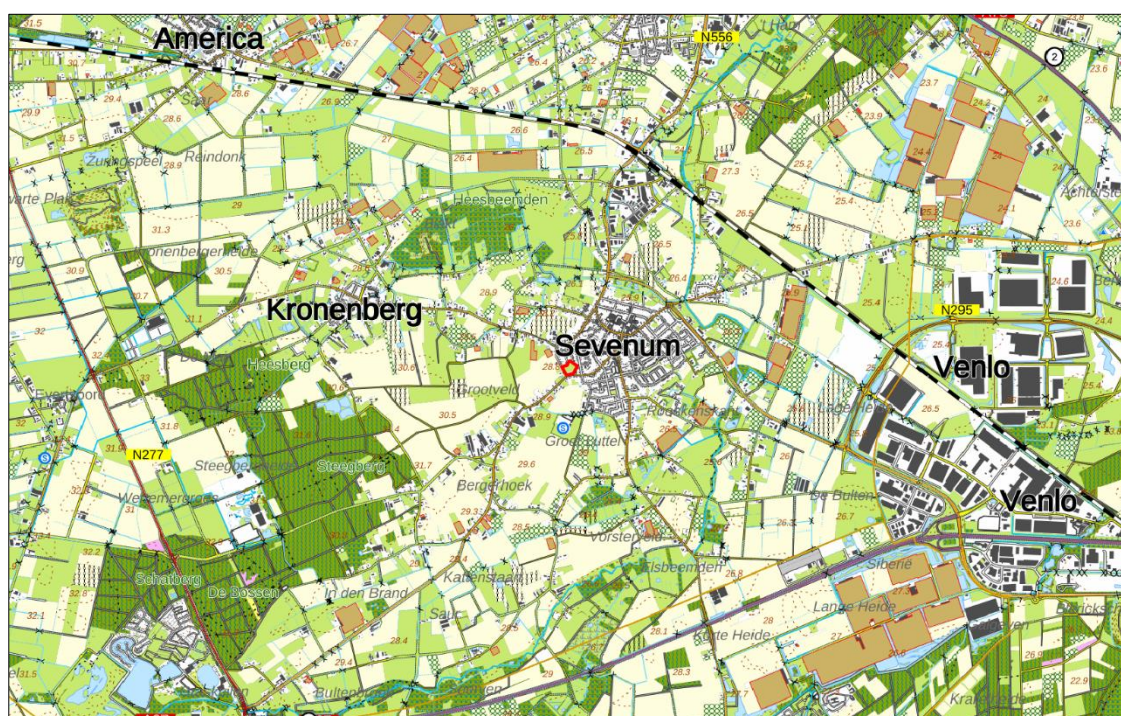
Figuur 1. Topografische kaart ligging van het plangebied (1:25.000)

Het plangebied is gelegen in het westen van Sevenum, tussen de Beatrixstraat en de Staarterstraat, aan de rand van een ontwikkelingslocatie woningbouw. In figuur 1 is de topografische ligging van het plangebied weergegeven.