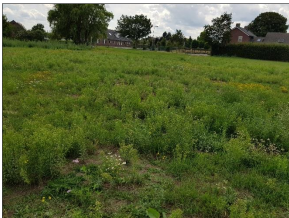
Figuur 8. Plangebied gezien vanaf noordoosten