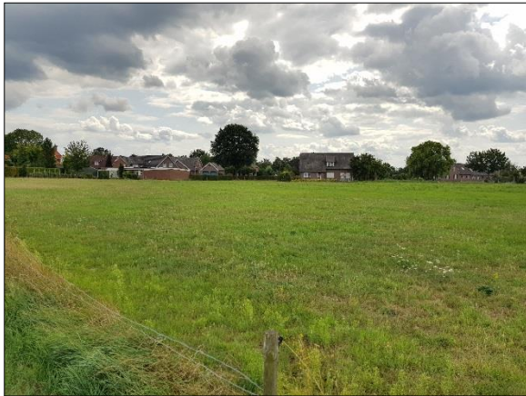
Figuur 4. Plangebied gezien vanaf noorden