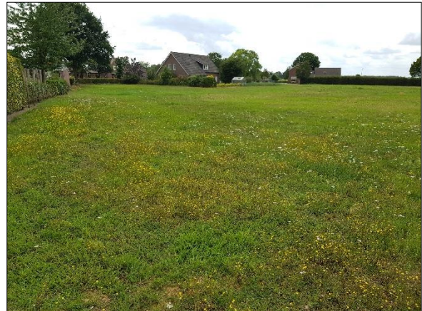
Figuur 5. Plangebied gezien vanaf oosten