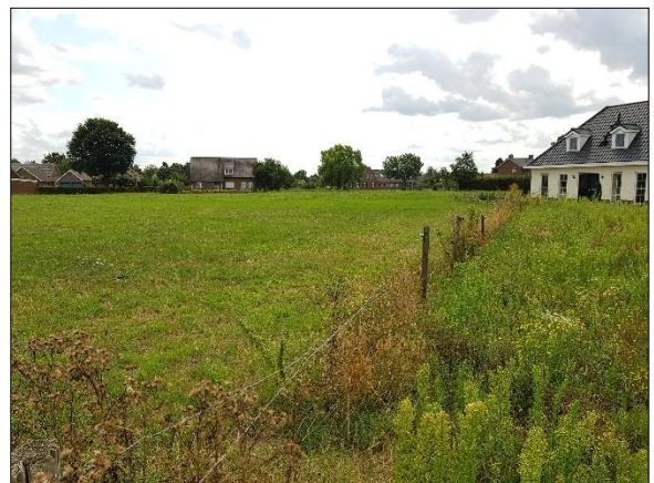
Figuur 9. Plangebied gezien vanaf noordoosten