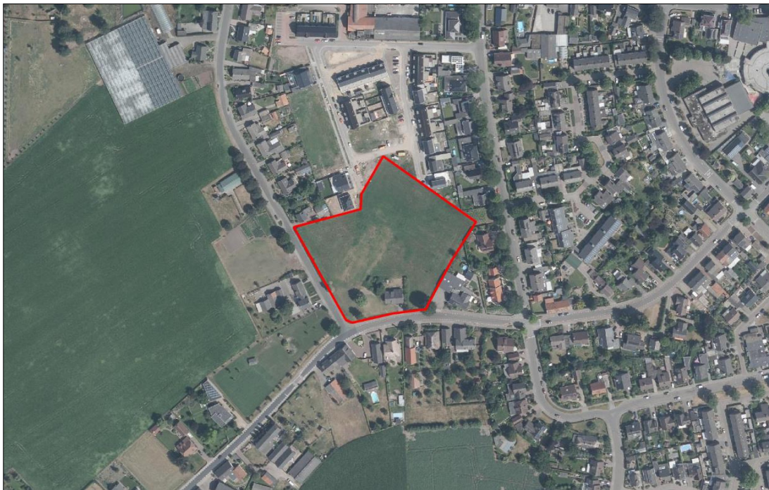
Figuur 2. Luchtfoto van het plangebied en de directe omgeving