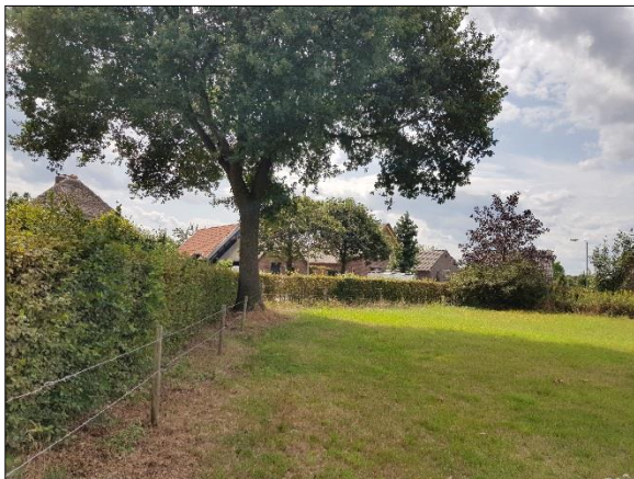
Figuur 6. Boom op grens plangebied gezien vanaf noordoosten