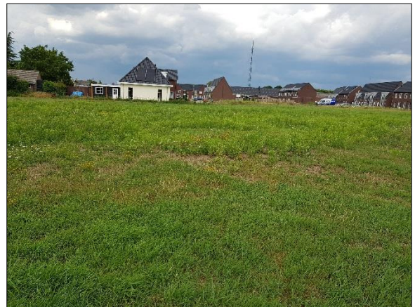
Figuur 7. Plangebied gezien vanaf zuidwesten