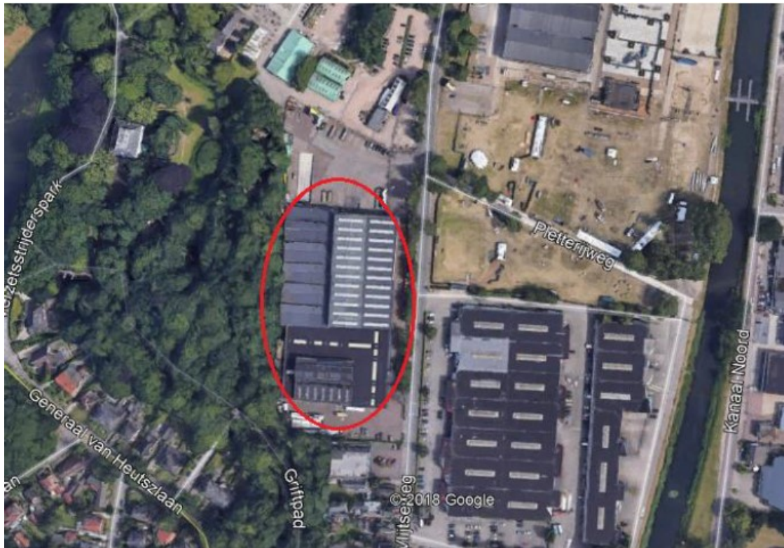
Figuur 1: Plangebied voormalig Remeha-terrein