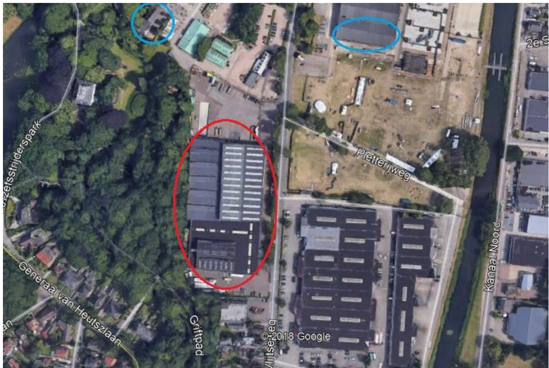
Figuur 2: Locaties tijdelijke vloermuiskasten (in beide blauwe cirkels 2 vloermuiskasten)