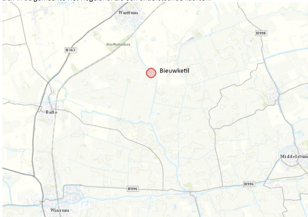
Afbeelding 1: In rood aangegeven de locatie van de Bieuwketil

De Bieuwketil ligt in het Warffumermaar nabij de Onderdendamsterweg 5 te Warffum. De brug bevindt zich in de gemeente Het Hogeland. Zie ook onderstaande kaarten.