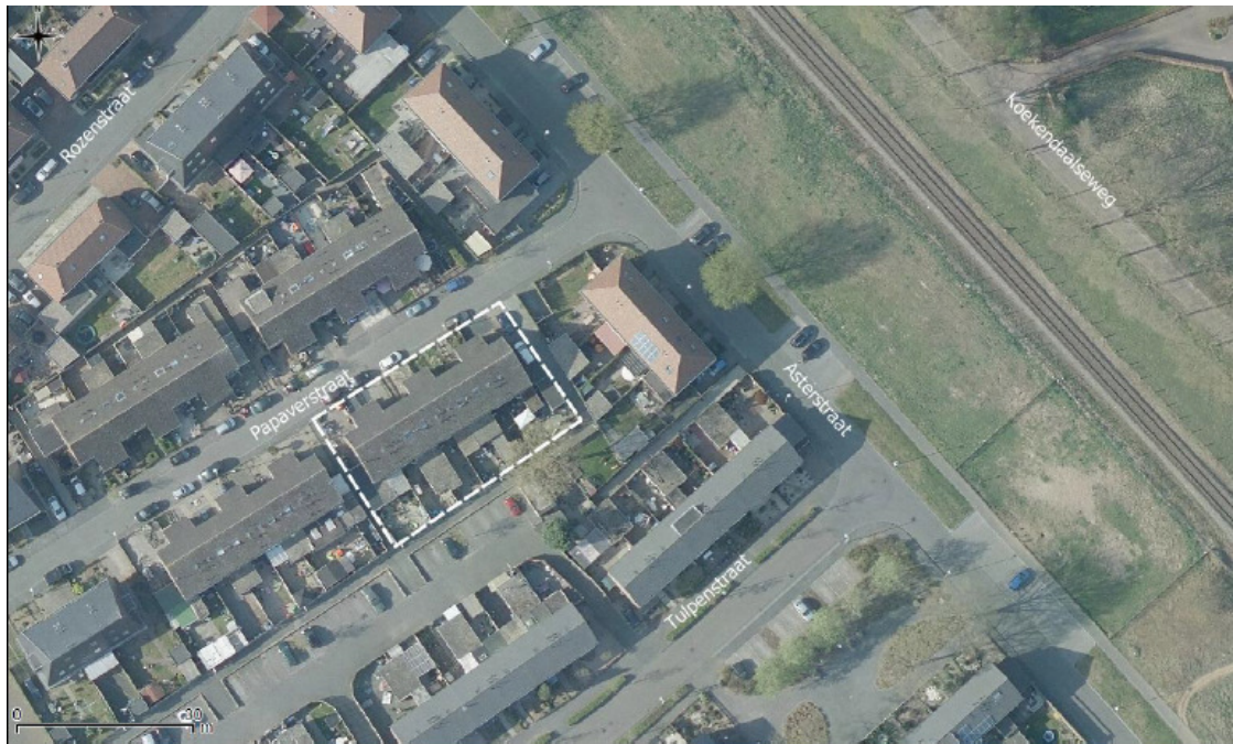
Figuur 1: Plangebied Papaverstraat 20-30 te Doetinchem