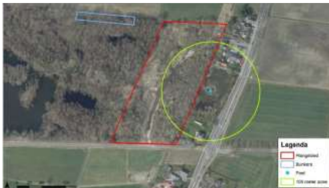
Figuur 2 – huidige projectgebied en habitat kamsalamander

Landhabitat (waaronder winterbiotop) van kamsalamanders bevindt zich doorgaans binnen 100 m afstand van de broedbiotopen. Een deel van het projectgebied bevindt zich binnen 100 m afstand tot de poel, zie figuur hieronder. Het gebied is begroeid met voornamelijk jonge bomen en op diverse plaatsen liggen takkenhopen en/of stobben. Dit maakt het gebied erg geschikt als landhabitat.