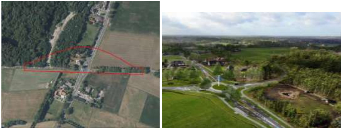
Figuur 1 – Huidige projectgebied (links) en schets toekomstige situatie (rechts).

De provincie Overijssel wil de kruising N733 Oude Deventerweg – Landweerweg in Enschede wijzigen. De huidige kruising wordt vervangen door een iets noordelijker gesitueerde rotonde 14 . De werkzaamheden bestaan uit het bouwrijp maken van het terrein en de aanleg van het nieuwe tracé, rotonde en verdere inrichting en afwerking van het terrein. Op het tracé van de Oude Deventerweg worden de aanwezige bomen en opschot geroid. Langs de Landweerweg worden enkele bomen geroid en worden enkele nieuwe bomen aangeplant. Rondom de rotonde worden eveneens nieuwe bomen geplant.