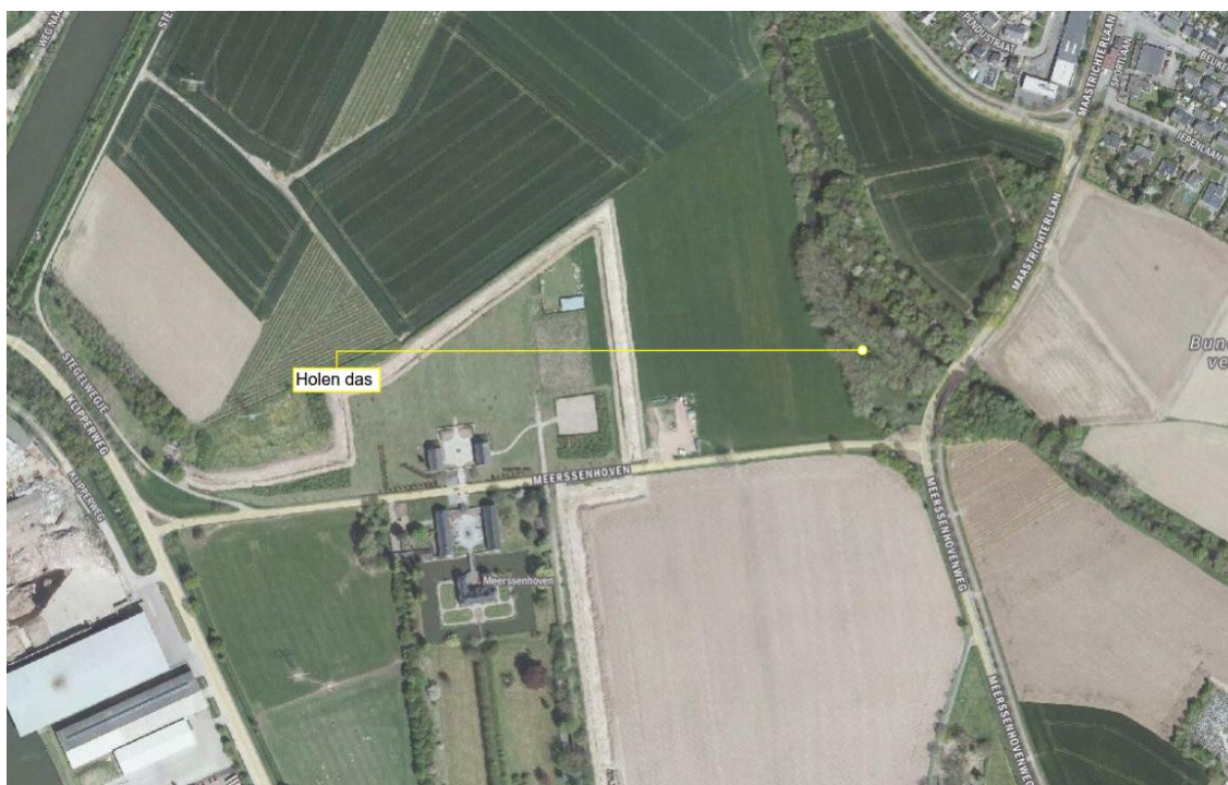
Afbeelding 3 Locatie van de aangetroffen dassenholen nabij de Kleine Geul.