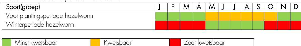
Tabel 9 Kwetsbare perioden hazelworm.