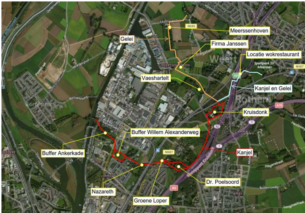
Abbeelding 1 Ligging plangebied van de Kanjel en de Gelei (rode, oranje en blauwe lijnen) met de verschillende onderdelen binnen het plangebied aangeduid met geel.