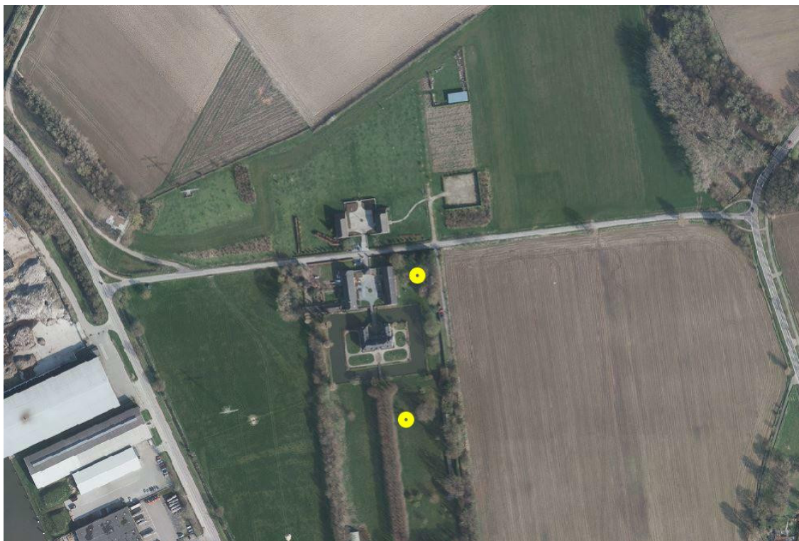
Afbeelding 2 Locaties van de twee aangetroffen steenuilkasten.

Ter plaatse van landgoed Meerssenhoven zijn twee nestkasten van de steenuil aanwezig. De nestkasten bevinden zich op 25 meter en 60 meter afstand van de werklocatie en zijn in afbeelding 2 aangegeven met een gele cirkel. Gezien de onderlinge afstand (130 meter) wordt verwacht dat beide kasten binnen één steenuilterritorium zijn gelegen. Het territorium van de steenuil bevindt zich ter plaatse van de gehele omgeving van landgoed Meerssenhoven, waarbinnen met name struwelen, weilanden, boomgaarden en andere afwisselende halfopen elementen van belang zijn voor de steenuil.