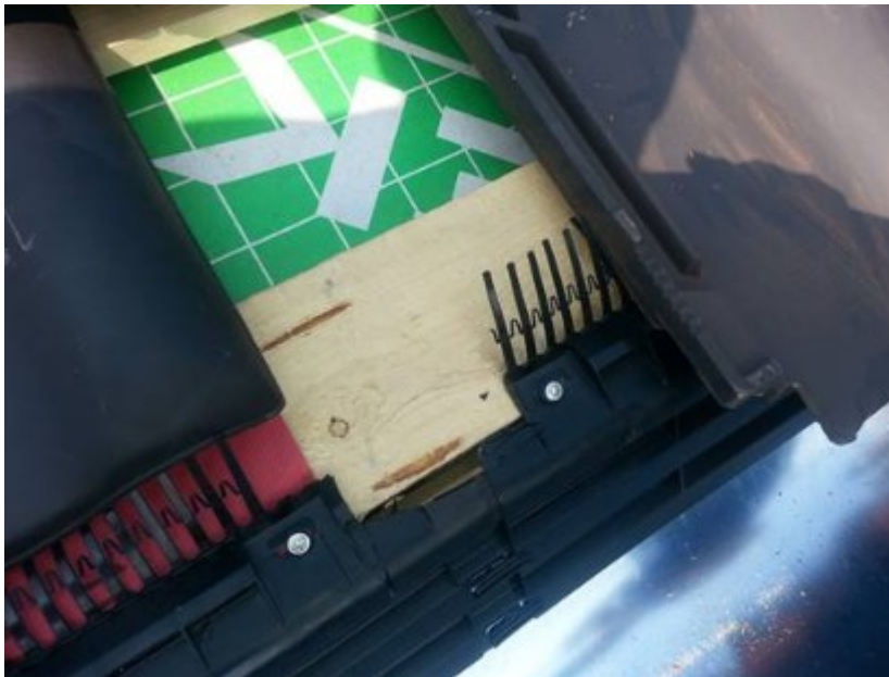
Vogelschroot eerste dakpan met doorgangen