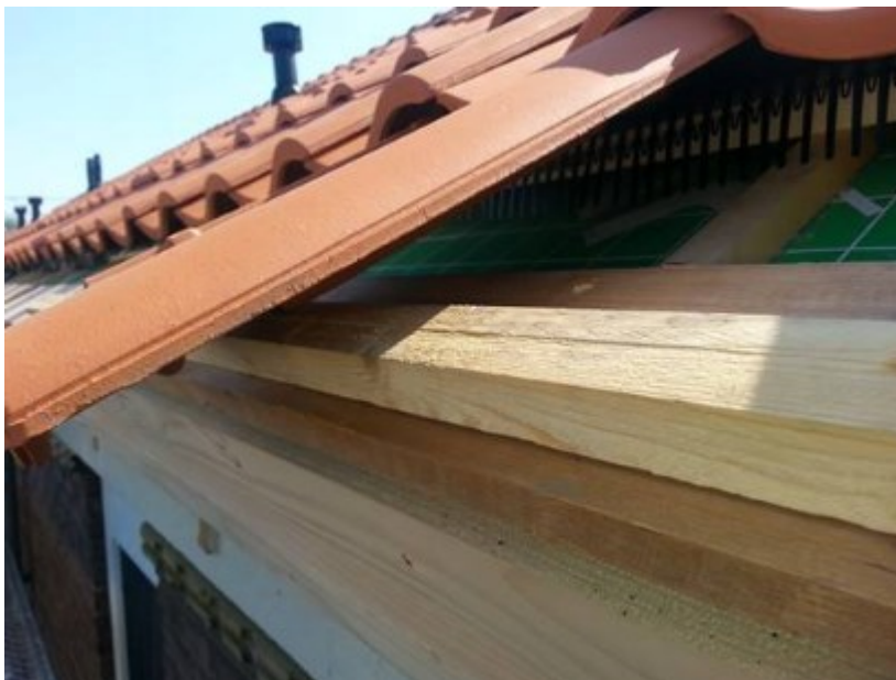
Vogelschroot 2 e dakpan