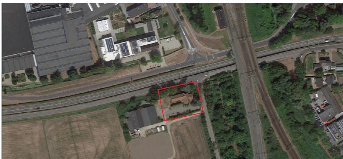
Figuur 2. Begrenzing plangebied Burgemeester Roozeveld van der Venlaan 11 Geldermalsen.