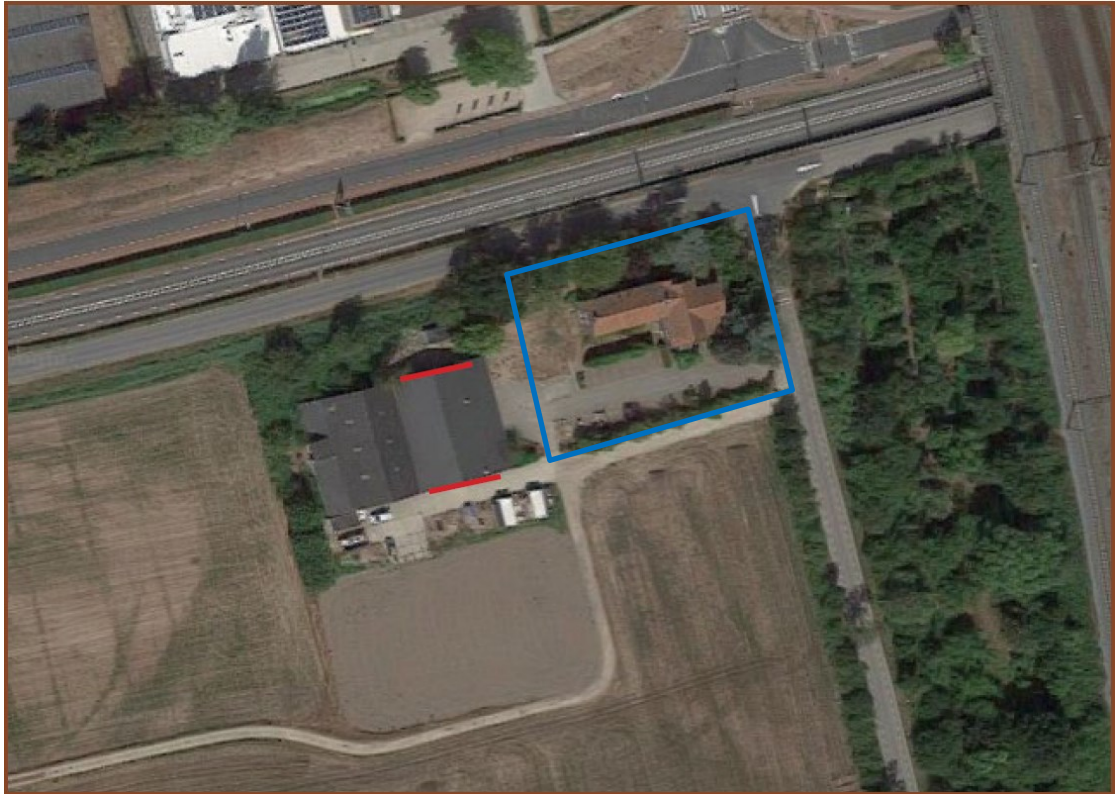
Figuur 4. Locaties van de permanente voorzieningen voor de gewone dwergvleermuis (rood) ten opzichte van het plangebied (blauwe kader).