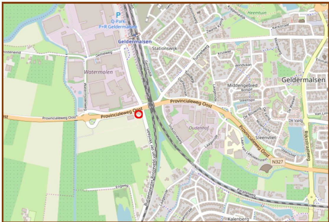
Figuur 1. Ligging plangebied Burgemeester Roozeveld van der Venlaan 11 Geldermalsen.