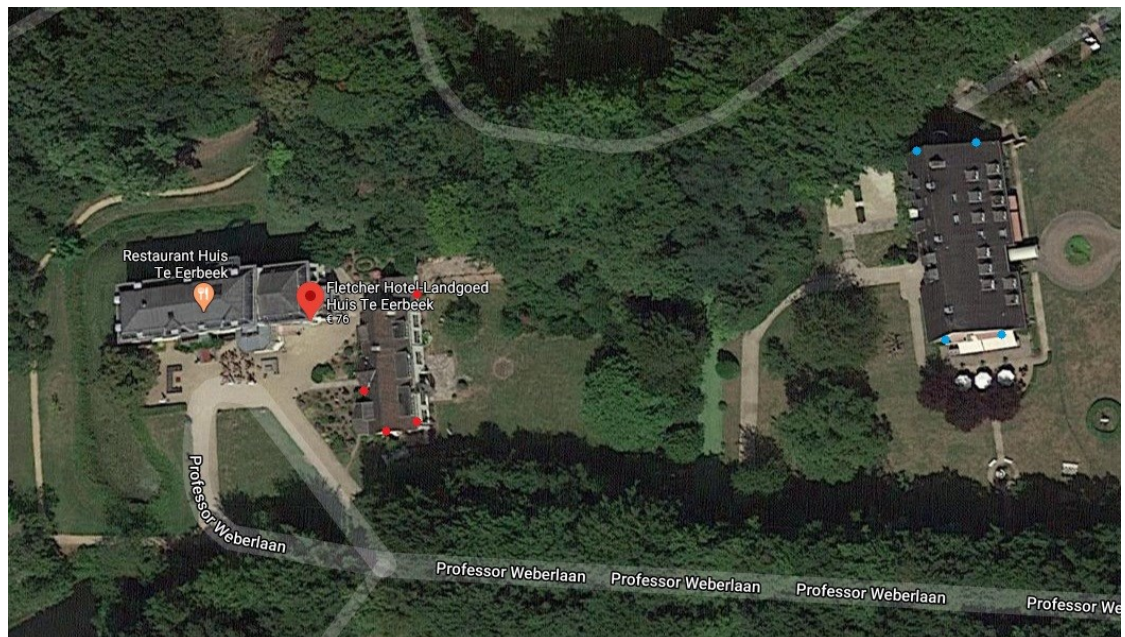
Figuur 2: Locatie van de tijdelijke alternatieve verblijfplaatsen (rood) en de permanente alternatieve verblijfplaatsen (blauw)