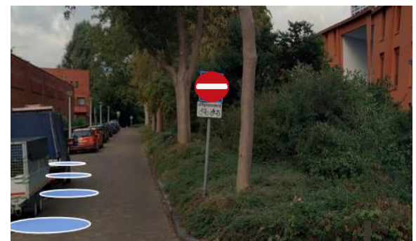
Nieuwe bebording locatie 3