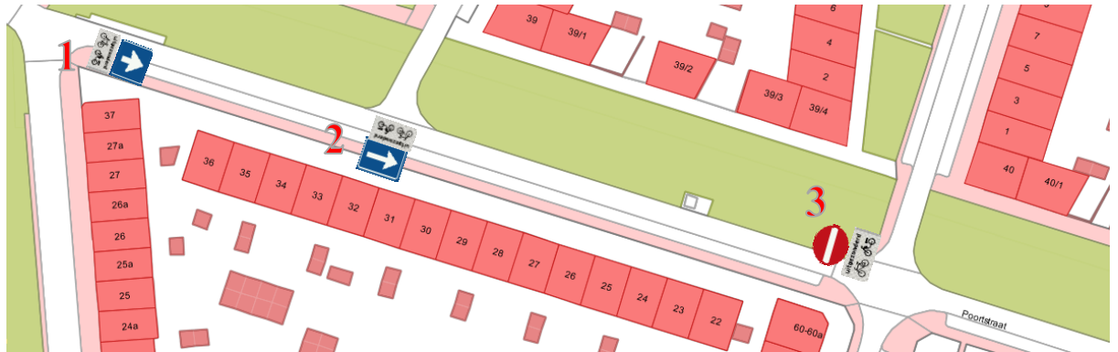
Nieuwe situatie Poortstraat (tussen de kruising met Agnetapark en Het Lansink)

Het ontwerp is toegevoegd. In de onderstaande afbeeldingen is te zien dat er in de nieuwe situatie sprake is van het omdraaien van het éénrichtingsverkeer.