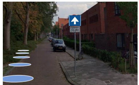
Nieuwe bebording locatie 1