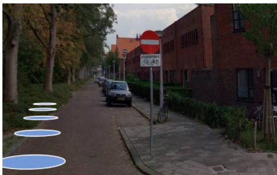
Huidige bebording locatie 1