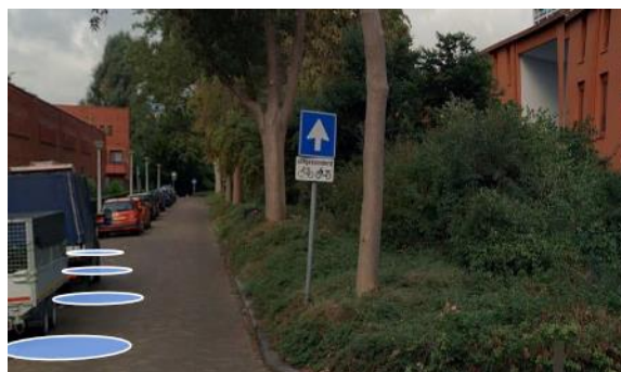
Huidige bebording locatie 3