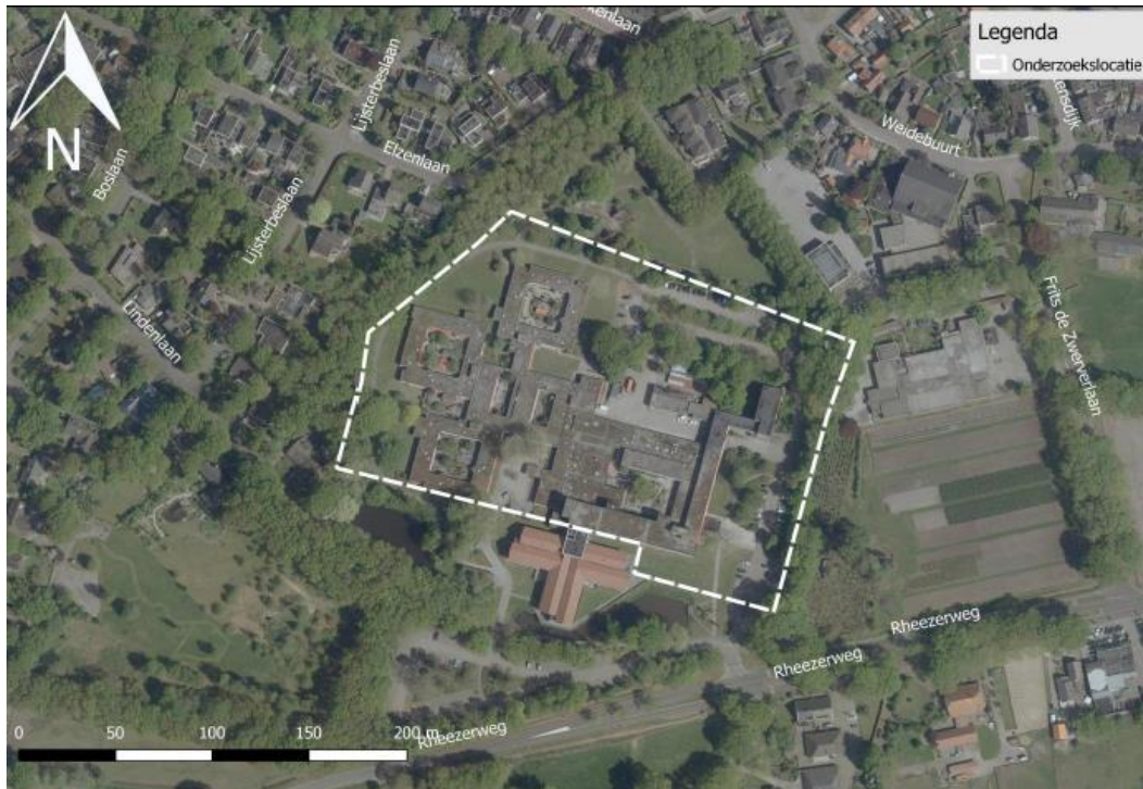
Figuur 1. Locatie zorgcentrum (te slopen delen omlijnd).

De locatie betreft het Zorgcentrum Clara Feyoena Heem, Rheezerweg 73 te Hardenberg. Het zorgcentrum bestaat uit verscheiden onderling verbonden wooncomplexen, met binnentuin.