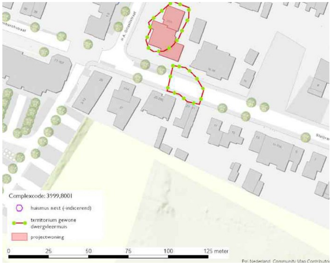
Figuur 1: Kaart plangebied met aangetroffen paarterritorium