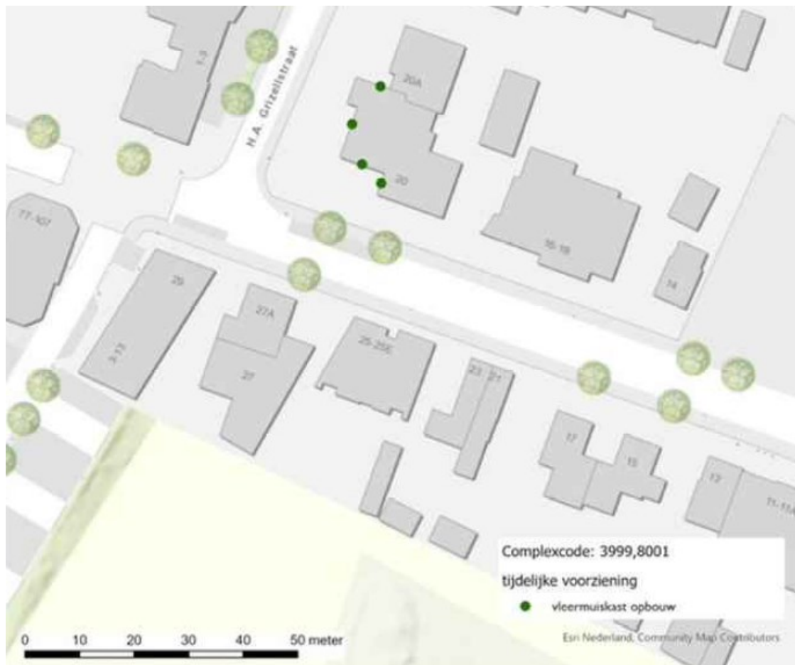
Figuur 2: Kaart tijdelijke mitigerende vleermuiskasten