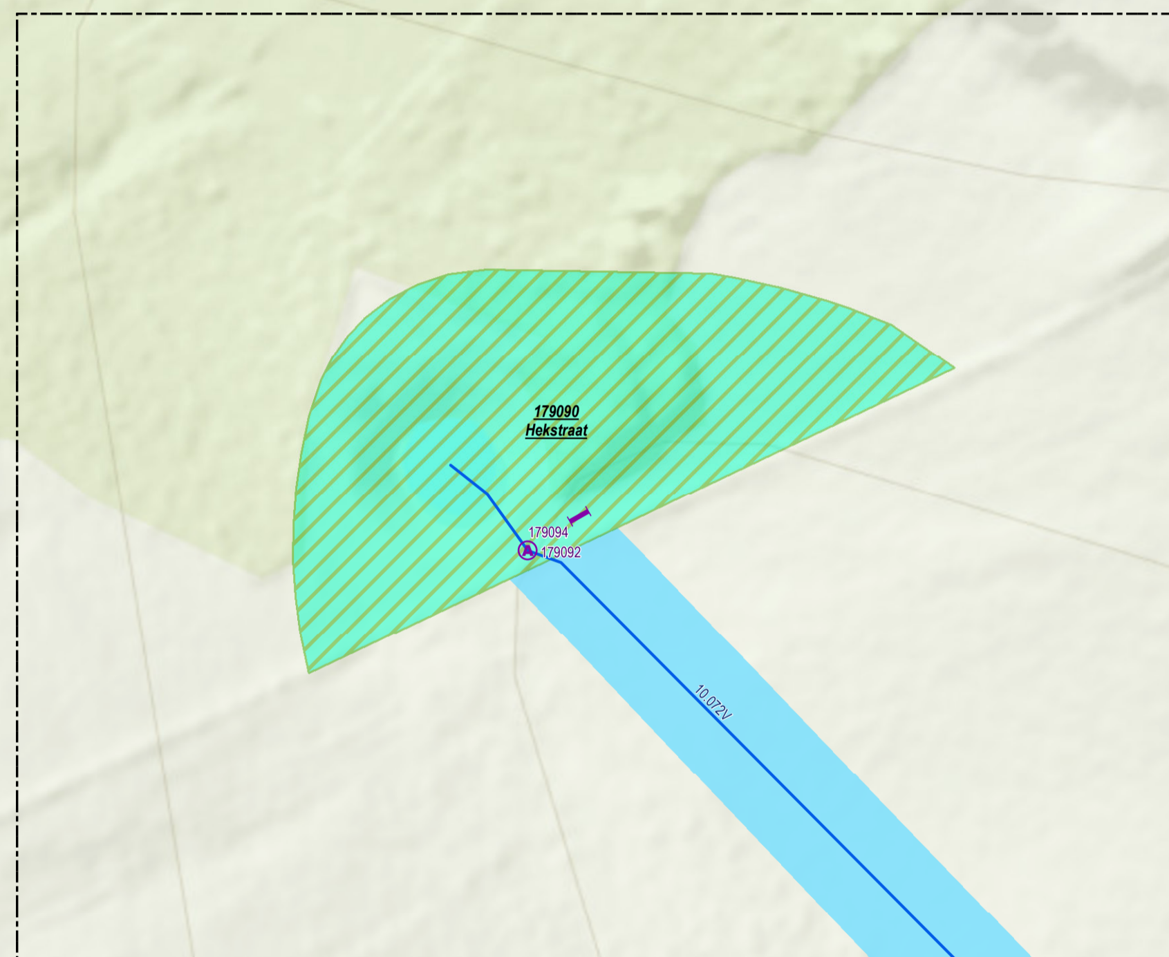
Overzichtskaartje (schaal 1:650.000)