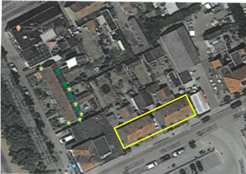
Figuur 2 – Locaties vervangende voorzieningen. Geel omkaderd: huidige projectgebied, gele sterren: nestkasten en groen: vogelvides.

De getroffen voorzieningen bieden ruim voldoende nestgelegenheden voor de drie te vernietigen verblijfplaatsen en vervullen dezelfde functie als de huidige verblijfplaatsen. De kans dat de huismussen de alternatieve verblijfplaatsen vinden en in gebruik nemen is hierdoor aannemelijk.