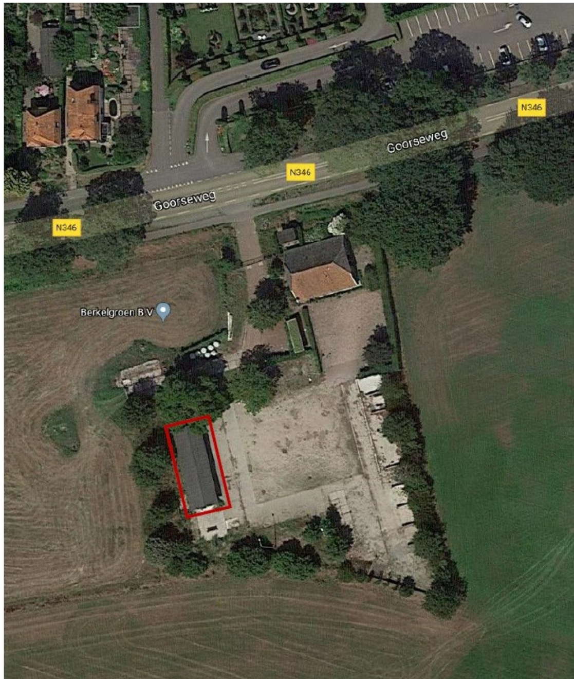
Figuur 1. Te slopen schuur (rode kader) met een verblijfplaats van een steenmarter aan de Goorseweg 22 te Lochem.