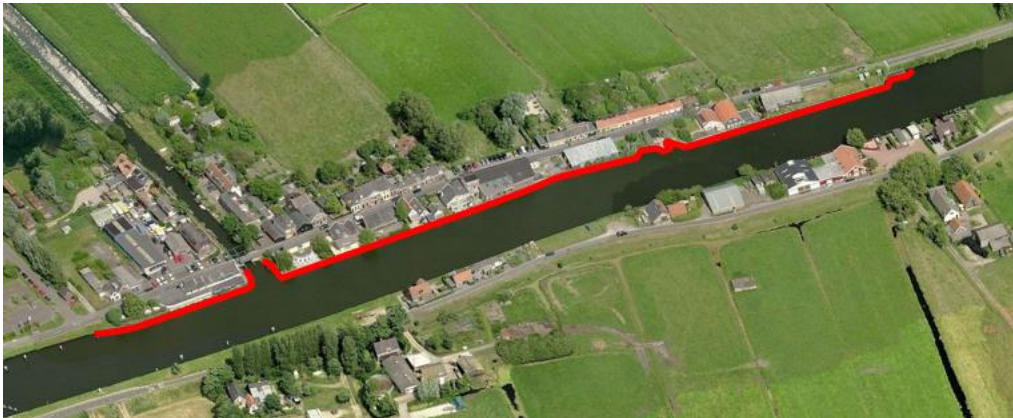
Projectgebied tracé regionale waterkering (verlegging naar de Schie)

De percelen aan weerszijden van de weg zijn particulier eigendom en in gebruik als woning met tuin. Ook is er een restaurant gevestigd. De Schie is grotendeels in eigendom van de gemeente Rotterdam. Een klein deel van de Schie is in eigendom bij de provincie Zuid-Holland en Delfland. De Rotterdamseweg is in eigendom van de gemeente Midden-Delfland. De Delftweg is eigendom van de gemeente Rotterdam. De provincie Zuid-Holland is eigenaar van een stuk grond dat wordt gebruikt als opslaglocatie.