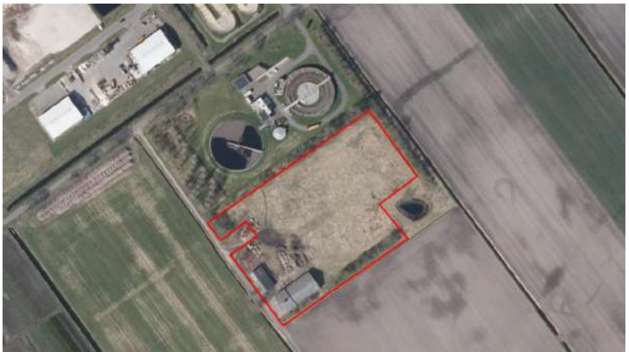
Figuur 1. Weergave locatie te realiseren zonnepark.

De werkzaamheden zijn gepland voor de periode 1 augustus 2020 en 28 februari 2021. Een ontheffing is aangevraagd tot en met 28 februari 2022. Hierbij wordt rekening gehouden met voorbereidende werkzaamheden en een eventuele uitloop van werkzaamheden als gevolg van onvoorziene omstandigheden.