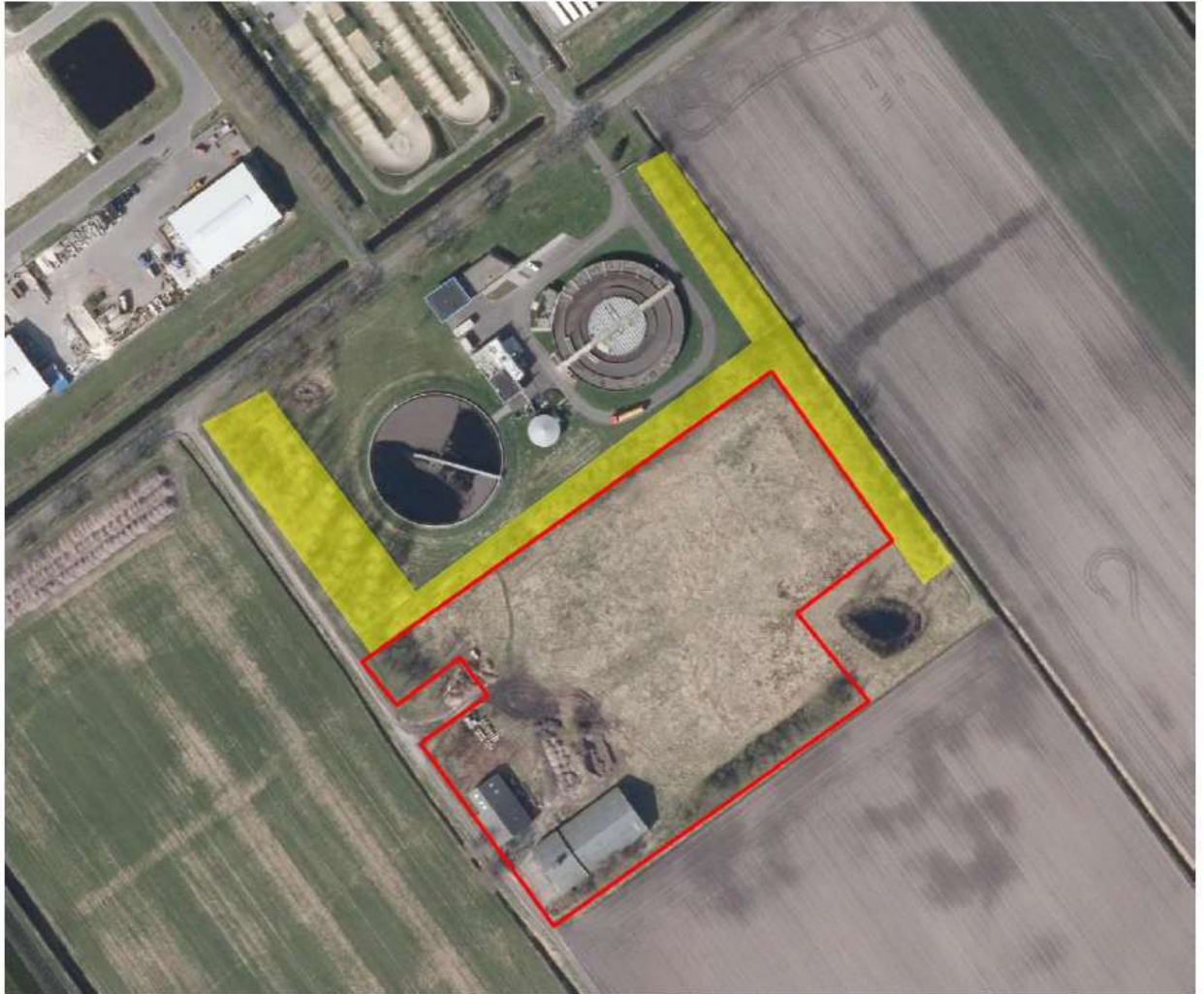
Figuur B2 het projectgebied (rood omlijnd) en het zoekgebied voor de plaatsing van de marterkasten (geel).