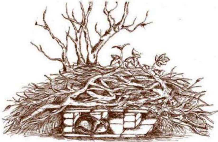
Figuur B1 Een tekening van een vervangende steenmarterverblijfplaats zoals voorgesteld door de zoogdiervereniging.