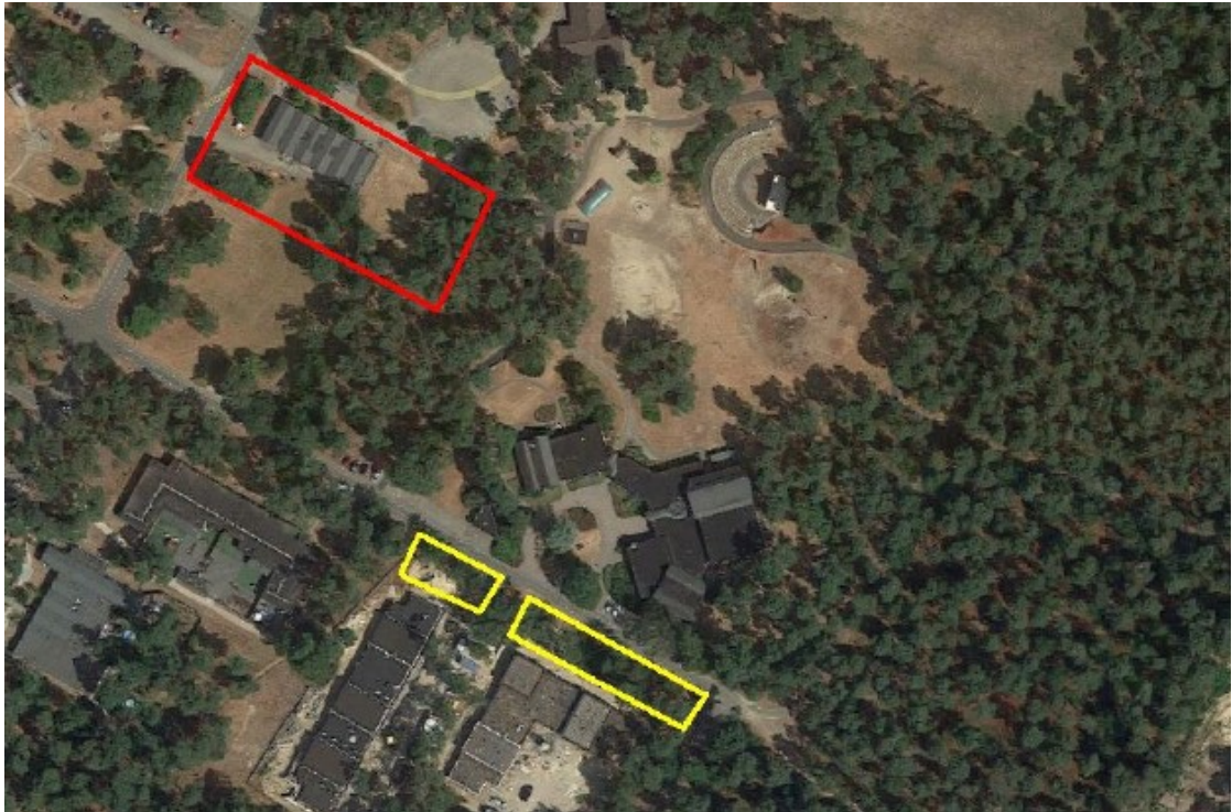
Figuur 4: Permanente alternatieve locaties voor de bunzing (geel) ten opzichte van het plangebied (rood)