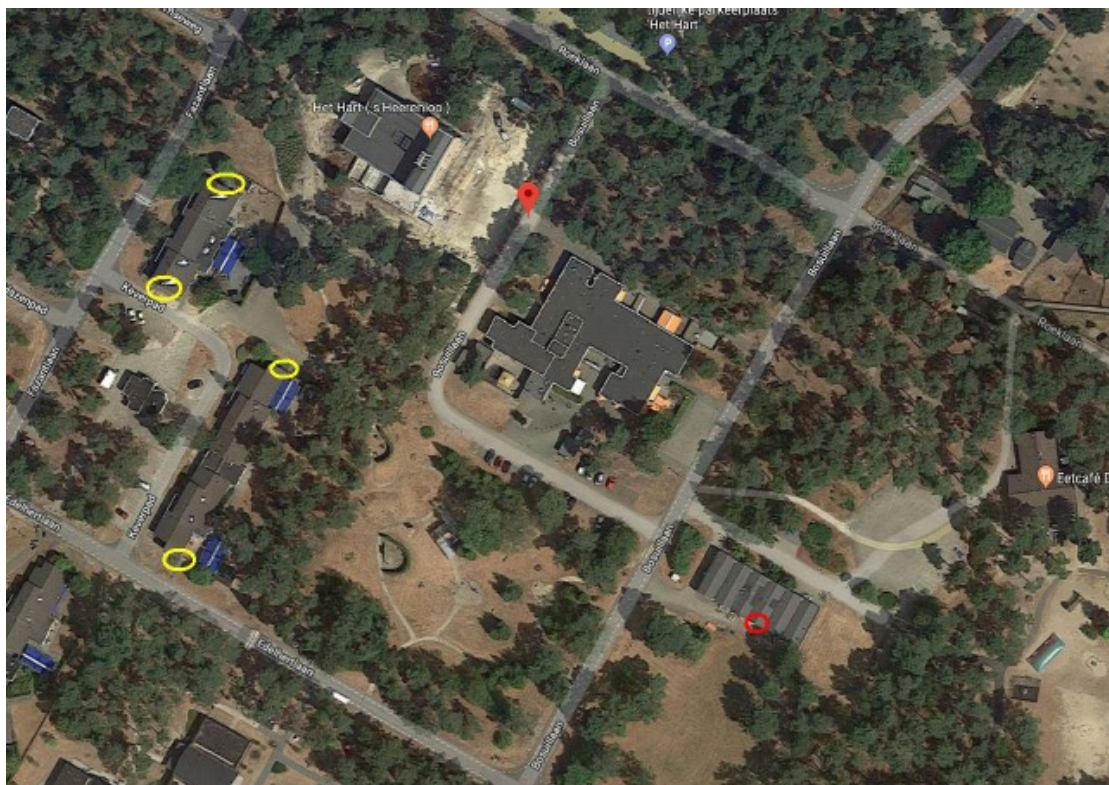
Figuur 2: Locaties van de tijdelijke kraamkasten (geel) ten opzichte van het plangebied (rood)