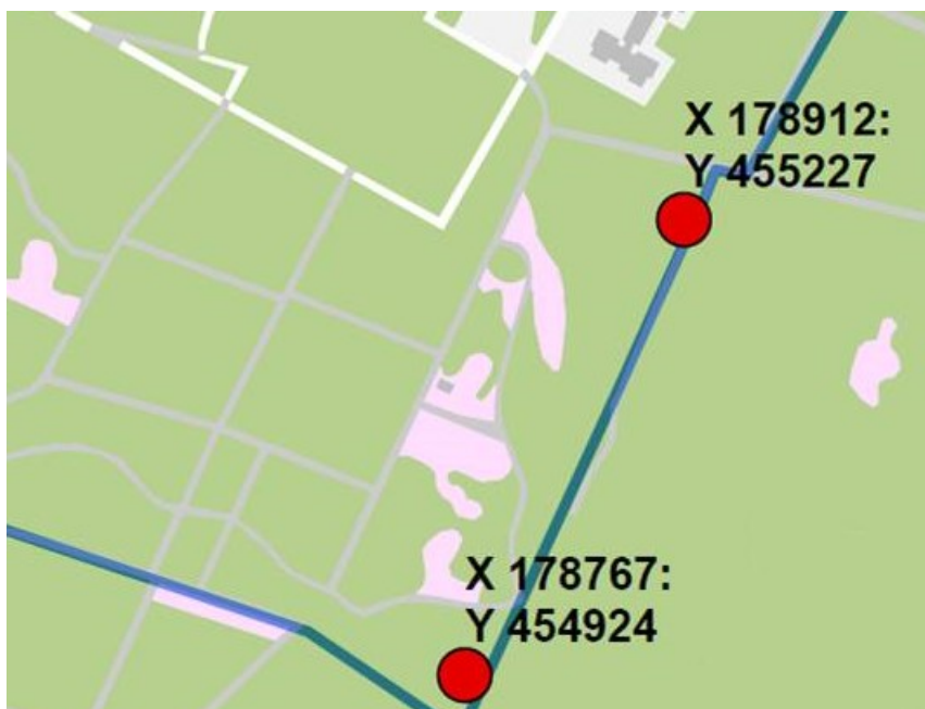
Figuur 3: Permanente alternatieve locaties voor de hazelworm inclusief rijksdriehoekskoördinaten.