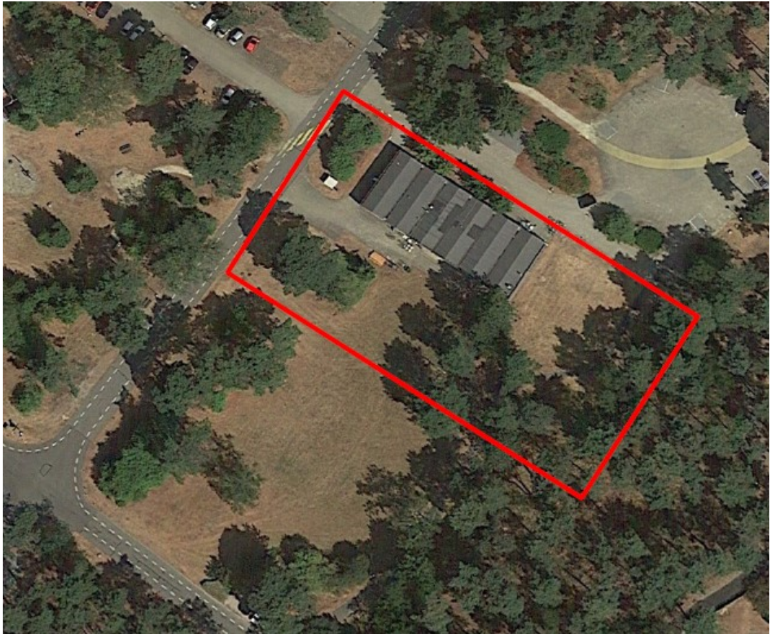
Figuur 1: Plangebied Bosuillaan 6, Wekerom