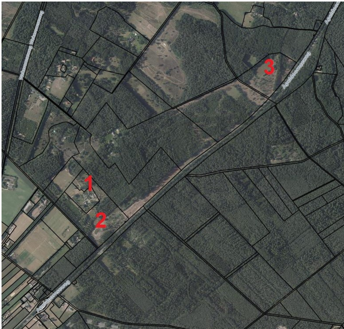
Figuur 4: Overzichtskaart van de mogelijk te kappen perceel (locatie 1) en het gekapte perceel (locatie 2) en de compensatielocatie (locatie 3).