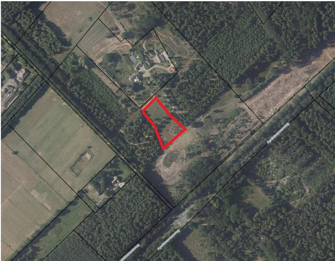
Figuur 2: Ligging perceel (met gegevens gemeente Ede, sectie B, nummer 4727), reeds gekapte houtopstand die gecompenseerd door herplant op een andere locatie (zie figuur 3).