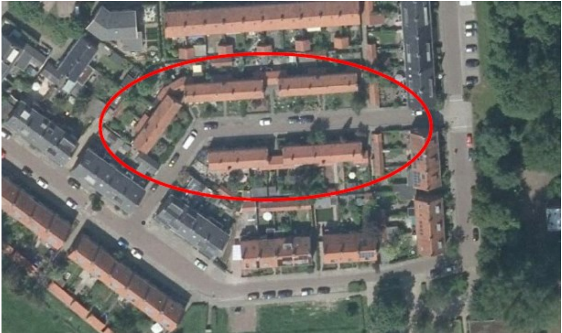
Figuur 1: Plangebied Keppelstraat 1 t/m 21, 2 t/m 14