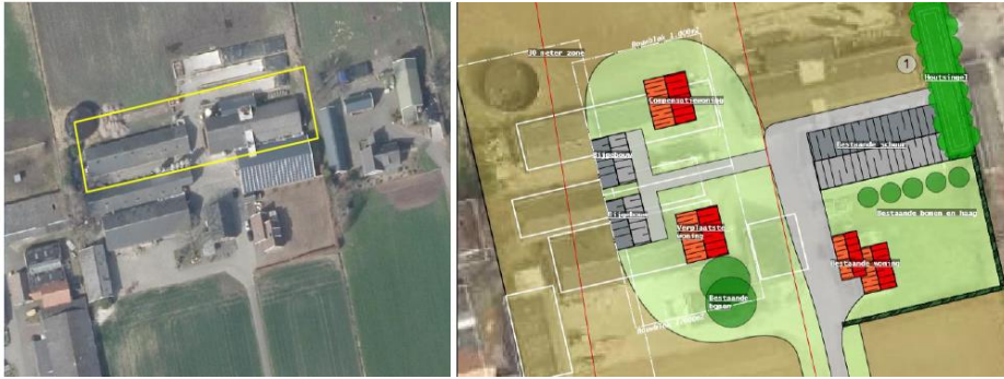
Figuur 1 – Projectgebied. Links het huidige beeld en rechts de toekomstige inrichting.