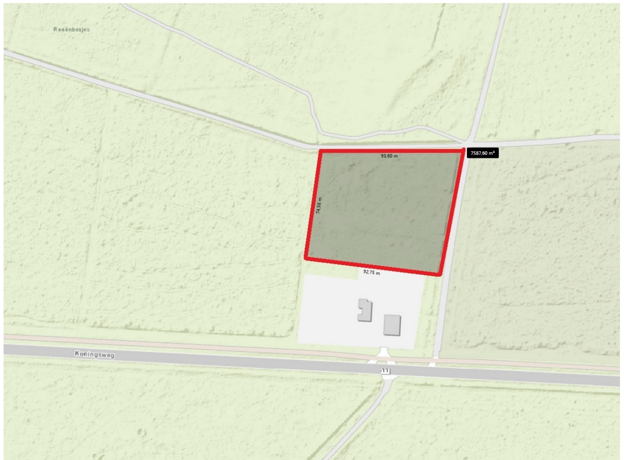
Kaart 2: Herplant locatie 1, voormalige natuurcamping.