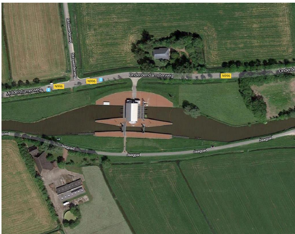
Fig. 1: situering gemaal Den Deel

De besturingskasten staan in het gebouw in de besturingsruimte aan de zuidzijde.