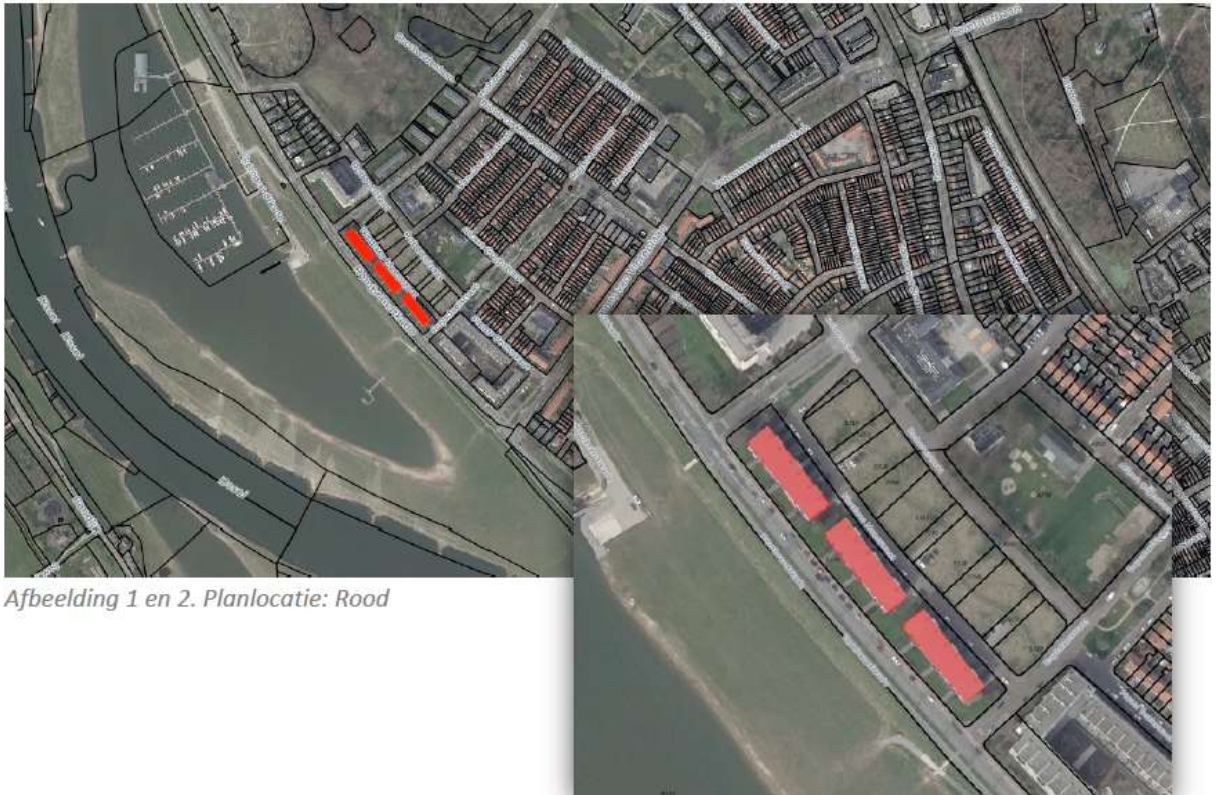
Afbeelding 1 en 2. Planlocatie: Rood