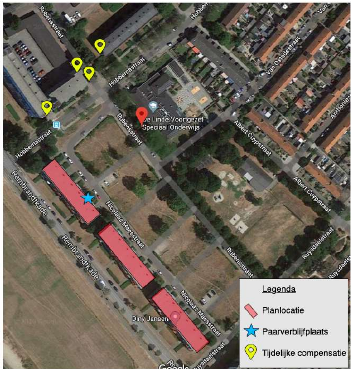
Afbeelding 3. Planlocatie (rood), paarverblijfplaatsen (blauw), vleermuiskasten (geel)