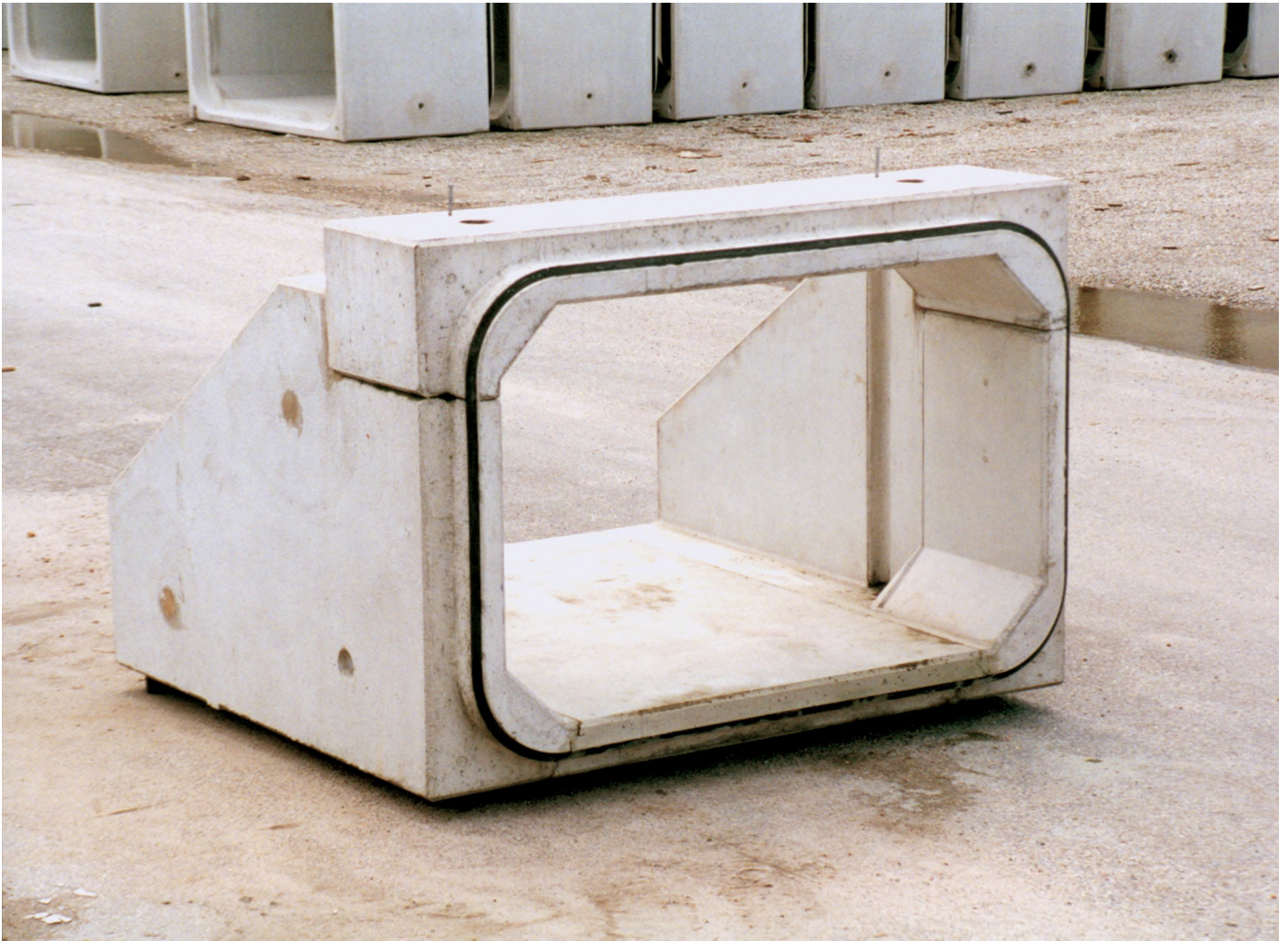
Overzicht inwendige afmetingen duikers in één overspanning