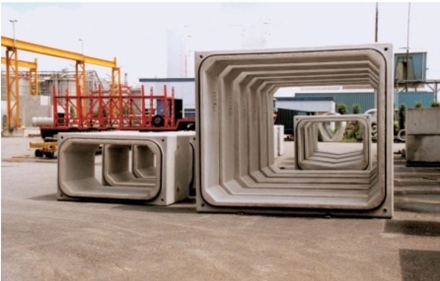
Duiker GR2 Rubberring