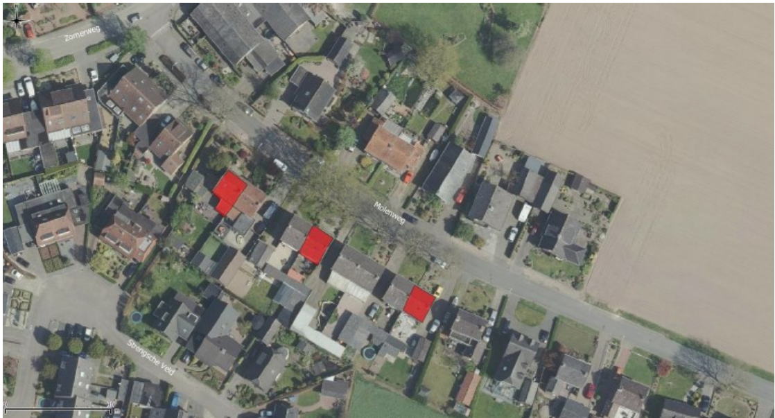
Figuur 1: Plangebied Molenweg 8, 14 en 22 te Achter-Drempht