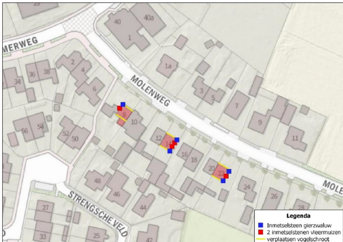
Figuur 2: Locaties van de permanente maatregelen