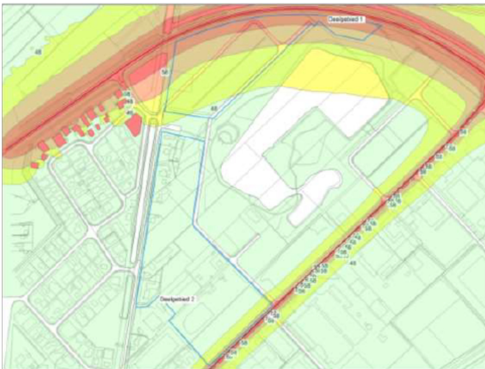
Figuur 2: Ligging 48, 53 en 58 dB contouren.

In de berekeningen is op grond hiervan respectievelijk 2 dB (N372) en 5 dB (Dwazziewegen) van de rekenresultaten afgetrokken. De berekeningen zijn uitgevoerd op hoogtes gekoppeld aan het op basis van het ontwerp te realiseren bouwhoogte. Daarom is een berekening uitgevoerd met waarneempunten waarbij de grenzen van het bouwvlak als gevel zijn aangehouden met een waarneemhoogte van 4,5 hoogte. De resultaten van de berekeningen zijn in de hiernavolgende afbeelding opgenomen. In bijlage 2 behorende bij de toelichting bestemmingsplan Herziening Haarveld d.d. 25 maart 2019 projectnummer 160.00.04.68.00 zijn de volledige berekeningen opgenomen en gemotiveerd.