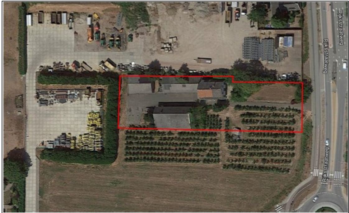
Figuur 1 Kaart projectgebied