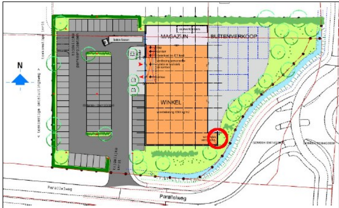
Figuur 3 Overzichtskaart permanente voorzieningen.