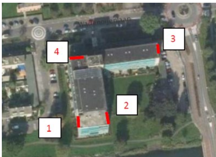
Figuur 3 Fasering van de te renoveren gevels en de locaties van de te realiseren vleermuisvriendelijke luchtpouwen.