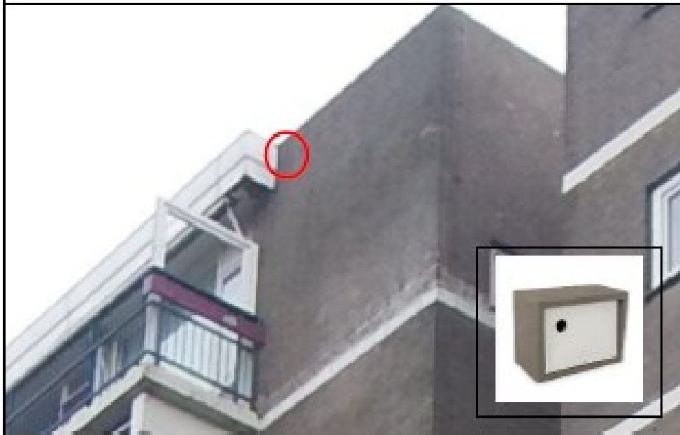
Figuur 1 Locaties van de permanente voorzieningen voor de huismus.