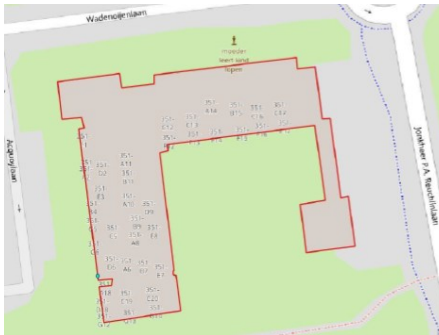
Figuur 1 Plangebied (rood omlijnd).