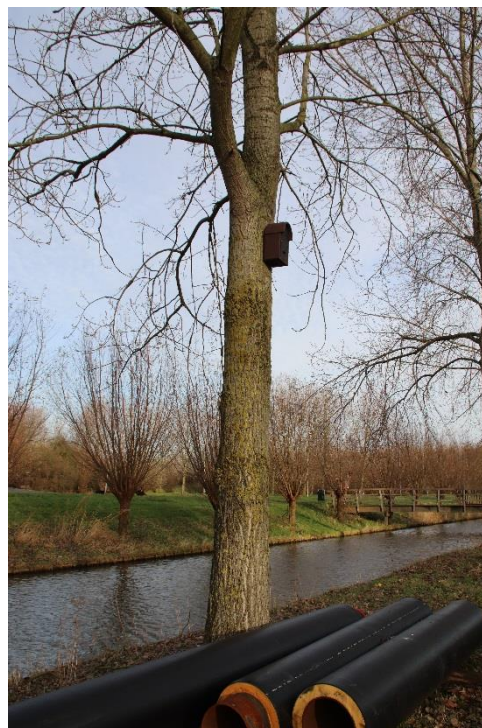
Foto: geplaatste vleermuis kast

De uitvoerder van het grondwerk heeft verder de plicht om archeologische vondsten te melden bij de bevoegde overheid, conform de Erfgoedwet.