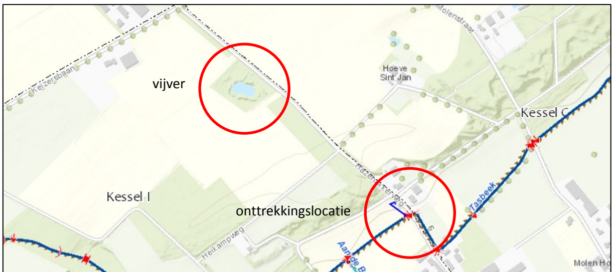
Kaart met onttrekkingspunt bij Tasbeek en locatie van de vijver

Het Tasbeek is ter plaatse van de aangevraagde activiteiten gelegen in de gemeente Peel en Maas en is als primair water opgenomen in de legger van Waterschap Limburg. Het Tasbeek heeft ter plaatse een profiel van vrije ruimte met een breedte van ruim 4 meter. Het oppervlaktewater heeft een natuurfunctie.