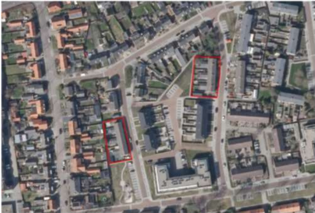
Luchtfoto met ligging van het projectgebied (rood omlijnd). Links: Beatrixstraat 14 t/m 24, rechts Margrietstraat 26 t/m 36.