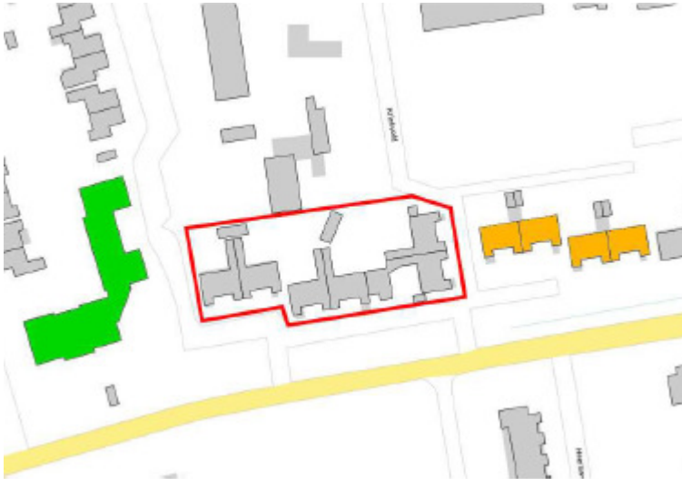
Figuur 2: Tijdelijke maatregelen huismus Het plangebied is rood omlijnd. De tijdelijke alternatieven voor de huismus worden gerealiseerd aan Kriekveld 1-5, oranje gearceerd