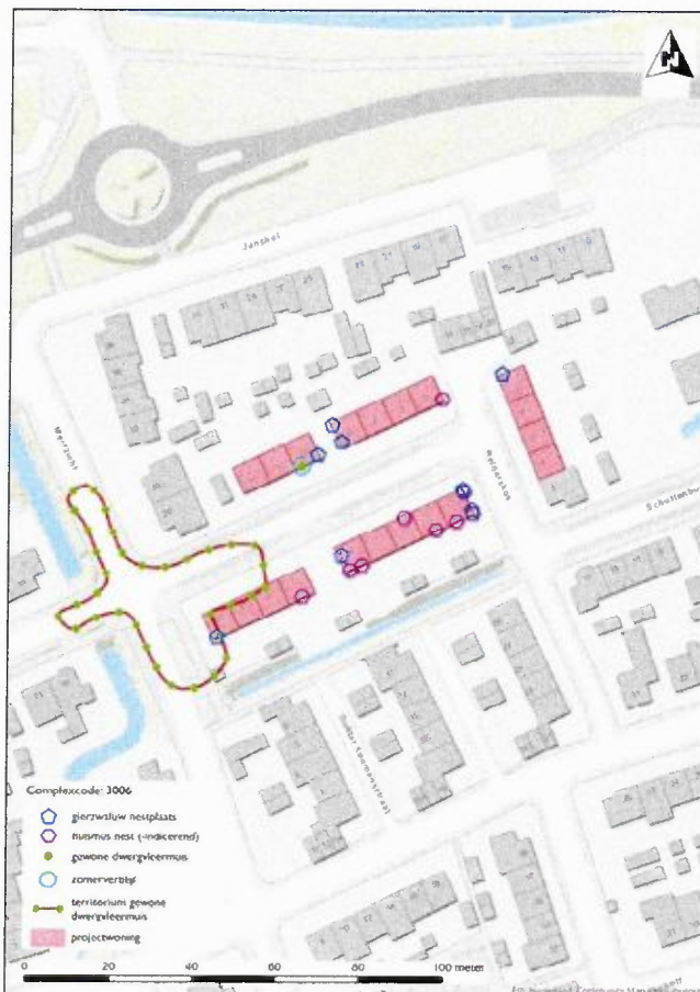
Figuur 1. Aangevonden verblijfplaatsen van beschermde soorten binnen complex 3006

Aanspreekpunt in het kader van deze ontheffing en de daaruit voortvloeiende voorschriften is het Servicebureau van de provincie Utrecht, Archimedeslaan 6, postbus 80300, 3508 TH te Utrecht, bereikbaar op telefoonnummer 030 – 258 33 11 of e-mailadres servicebureau@provincie-utrecht.nl .