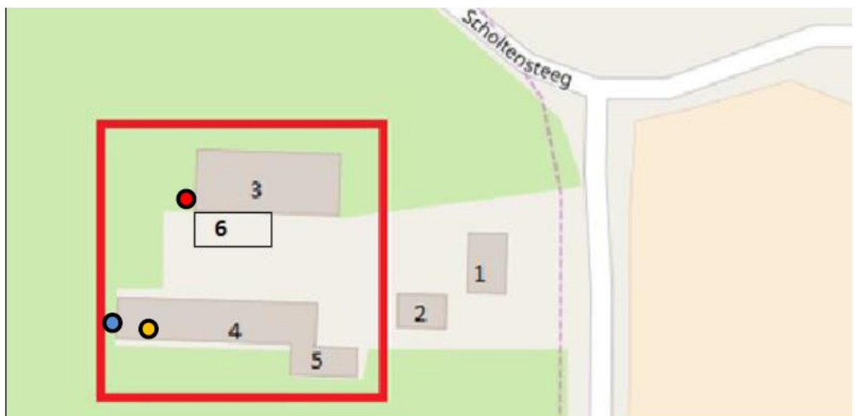
Figuur 5.2. Oude verblijfplaats (gele cirkel) ten opzichte van tijdelijke verblijfplaats (rode cirkel) en permanente verblijfplaats (blauwe cirkel).