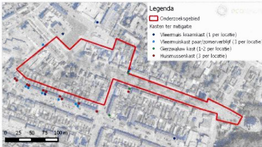
Afbeelding 3: Overzicht geplaatste (kraam)kasten. Het op deze afbeelding afgebeelde onderzoeksgebied, heeft betrekking op een andere ontwikkeling. De op deze afbeelding aangegeven kraamkasten vervullen geen functie voor deze ontwikkeling.