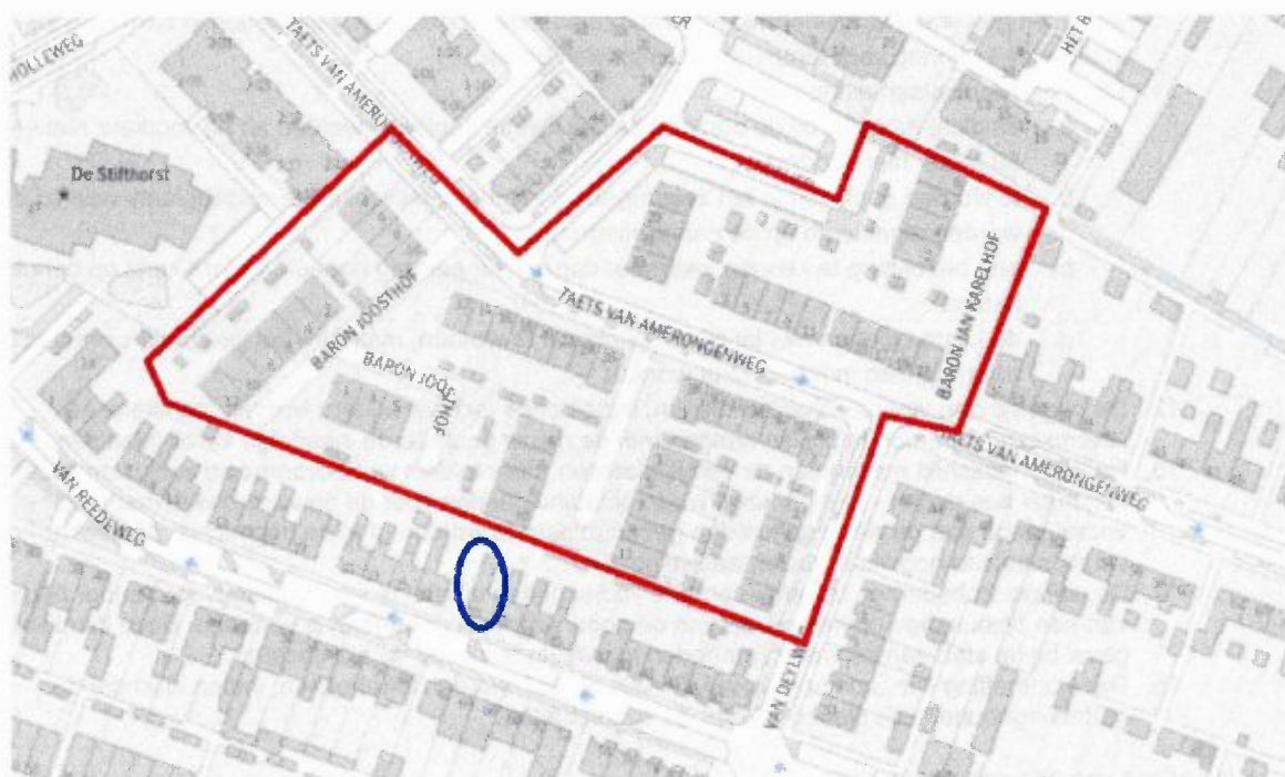
Afbeelding 1: De Van Reedeweg 29 is blauw omlijnd. De recente nieuwbouw is rood omlijnd.