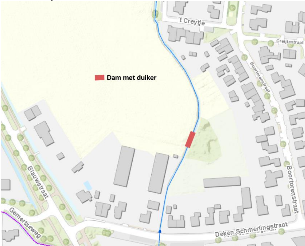
Afbeelding 2: Te realiseren dam met duiker