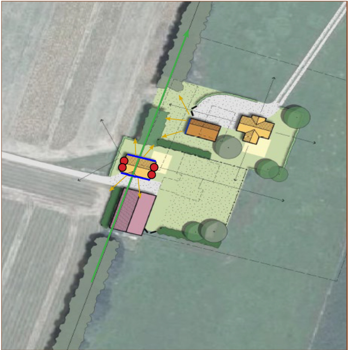
Figuur 3. Toekomstige situatie projectlocatie en locaties permanente verblijfplaatsen in de vorm van inbouwkasten (rode stippen).