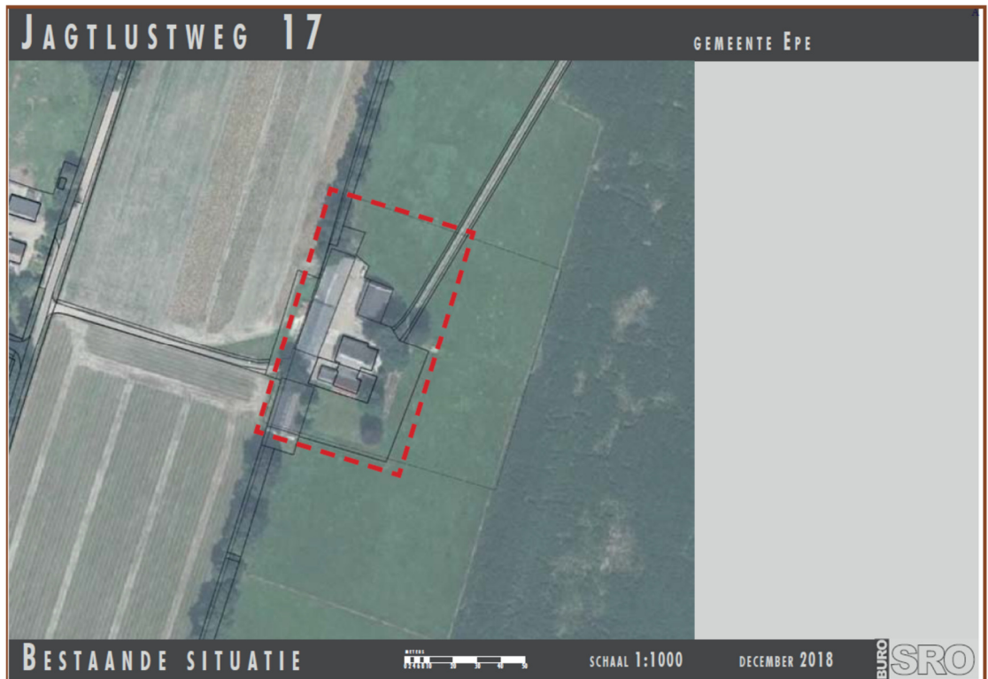
Figuur 1. Ligging en begrenzing plangebied Jagtlustweg 17 te Epe.