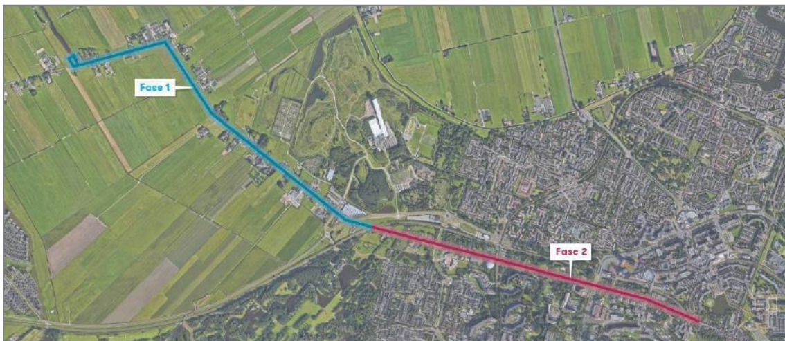
figuur: fasering project

Het kadeverbeteringstraject is gelegen tussen Wilsveen 5 en Vlamingstraat 4. Het traject is opgedeeld in twee fase. Deze staan hieronder afgebeeld. Het voorliggende projectplan heeft betrekking op fase I van het project.