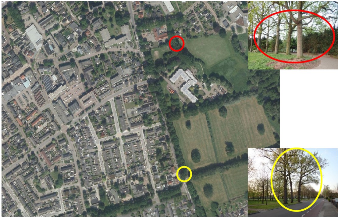
Figuur 2. Locaties tijdelijke vleermuiskasten gewone dwergvleermuis.