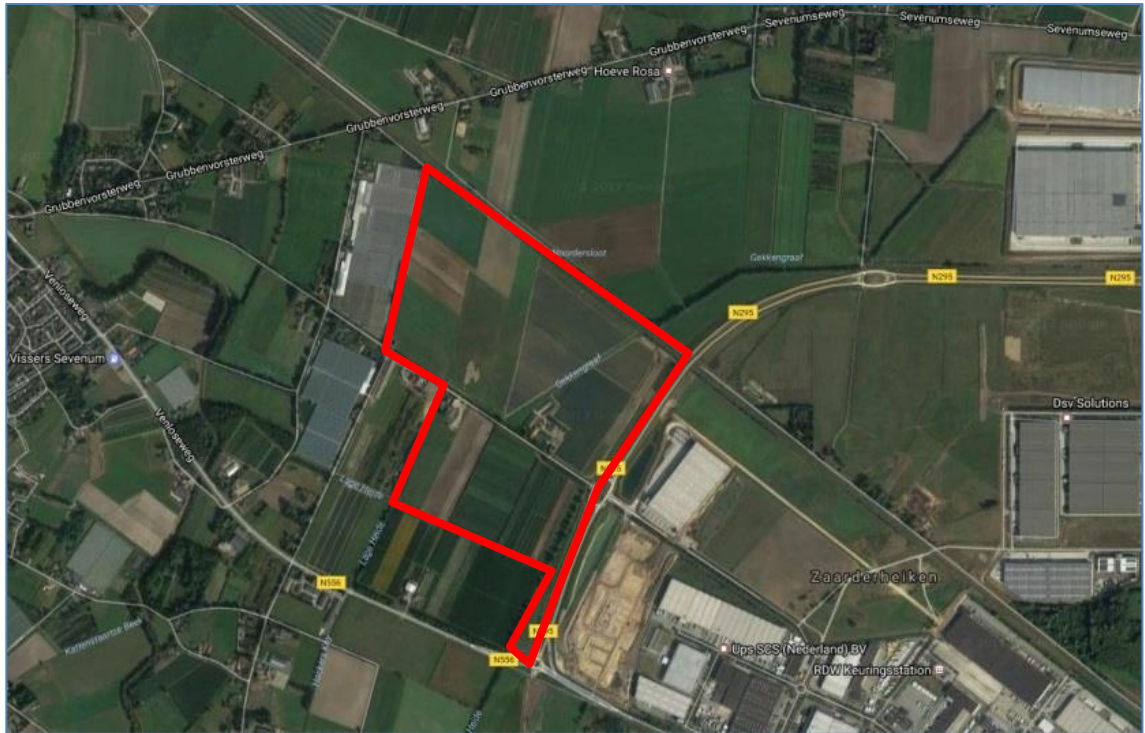
Figuur: Luchtfoto met het plangebied en directe omgeving

Het plangebied wordt begrensd door de spoorlijn Venlo-Eindhoven in het noorden, de provinciale weg N295 in het oosten, Venloseweg en een fruitteeltbedrijf in het zuiden en de Zeesweg, Dorperdijk en Heerstraat met aangrenzende bebouwing waaronder woningen en glastuinbouwbedrijven in het westen.