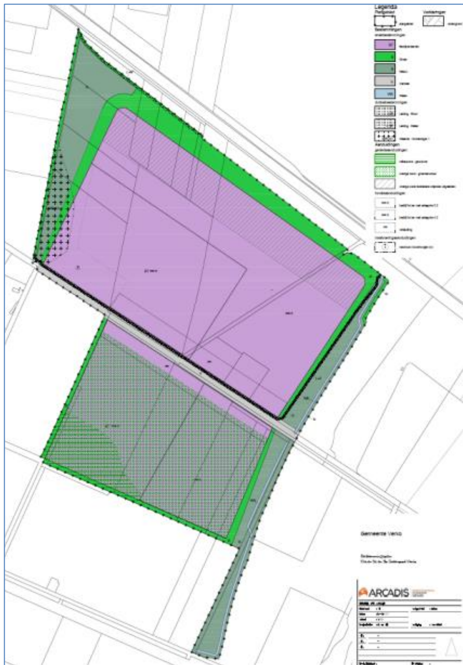
Figuur: Verbeelding Concept bestemmingsplankaart Klaver 5 fase I.

Op het moment dat deze risicoanalyse wordt uitgebracht, is het nieuwe planologische regime nog niet in werking getreden. De ontwikkeling zal planologisch mogelijk worden gemaakt door middel van een nieuw bestemmingsplan “Klaver 5 fase I” gemeente Horst aan de Maas.