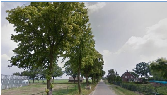
Figuur: foto ter hoogte van Dorperdijk 12 richting het plangebied