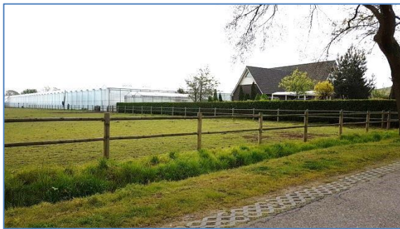
Figuur: foto ter hoogte van de Heerstraat 3

De woningen Grubbenvorsterweg 47, 49 en 53 worden naast de spoorlijn ook met een openbare weg met de tegenover gelegen woningen met erf en of met cultuurgrond van het plangebied gescheiden.