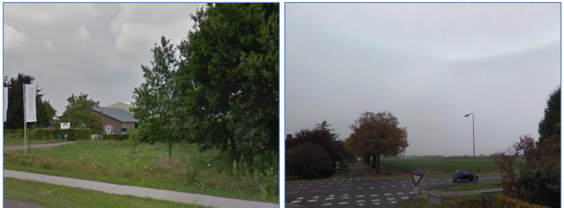
Figuur: links foto Venloseweg 53 rechts foto vanaf de kruising Venloseweg / Zeesweg

De objecten Venloseweg 38 en Zeesweg 10 en 14 worden van het plangebied gescheiden door een openbare weg en een agrarisch perceel.