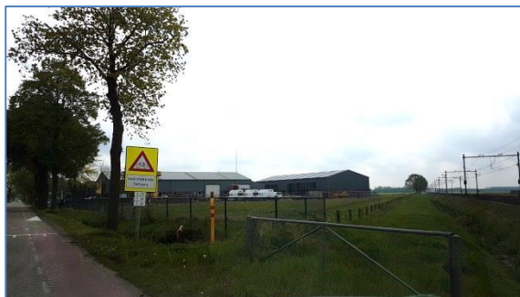
rechts foto vanaf de kruising Grubbenvorsterweg / Heerstraat