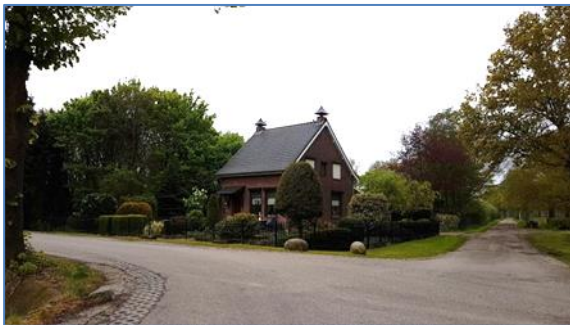
Figuur: foto Dorperdijk 16

Het object Dorperdijk 20 grenst direct aan het plangebied.