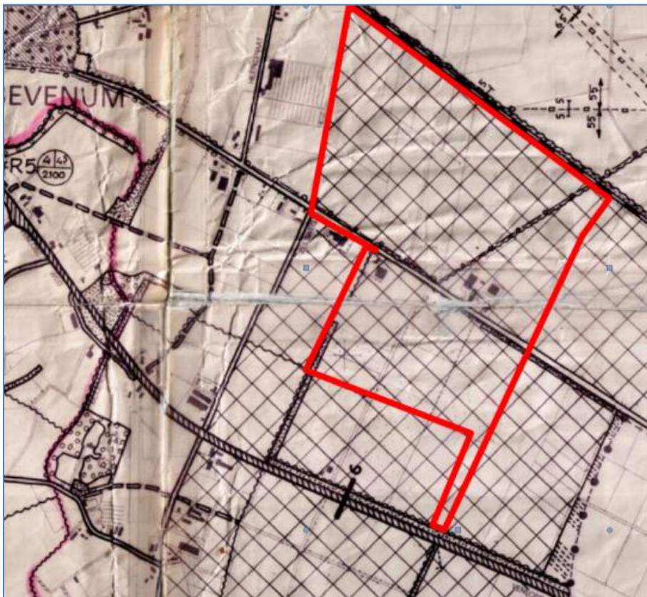
Figuur: Fragment plankaart Buitengebied Sevenum 1998

Het plangebied heeft de volgende hoofdbestemming: