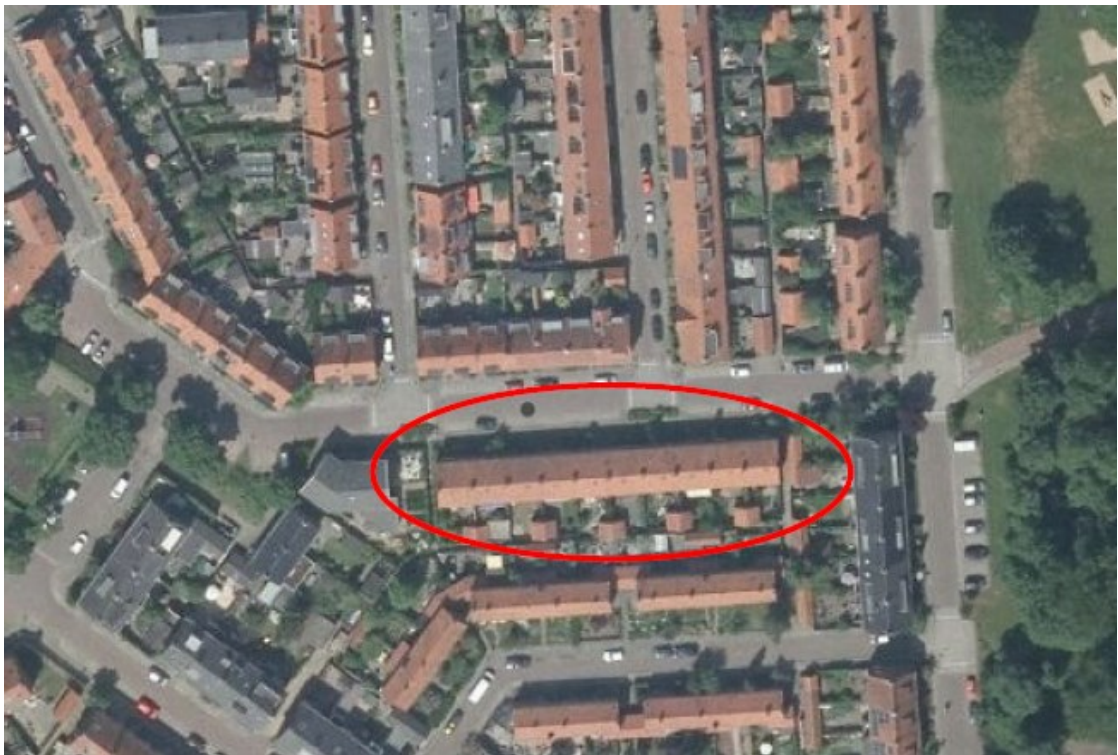
Figuur 1: Plangebied van Hasseltstraat 2 t/m 20 te Zutphen