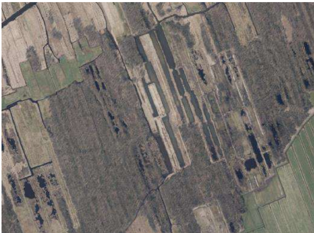
Figuur 3. Foto omgeving terrein ontgronding met gebiedskenmerken

De petgaten worden gegraven op locaties waar vroeger voor de turfwinning ook petgaten gegraven zijn. Op de foto Zwartsluis (Figuur 3) zijn in het midden de nieuw gegraven petgaten (begin jaren 1980) zichtbaar, met eromheen nog restanten van deels open water/jonge verlandingsstadiën van oorspronkelijk gegraven petgaten in de verveningstijd.