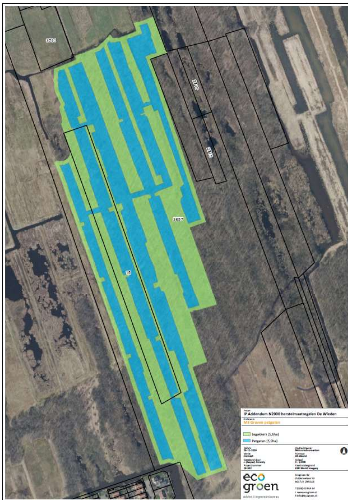
Figuur 1. Kadastrale aanduiding en ligging te ontgronden terrein.