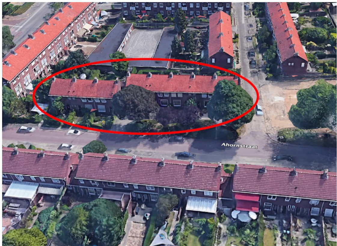
Figuur 1: Overzicht plangebied Ahornstraat 31-45B te Nijmegen